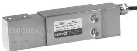
Рисунок 5 - Общий вид датчиков серии В6Н