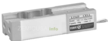
Рисунок 11- Общий вид датчиков серии L6C