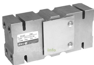
Рисунок 3 - Общий вид датчиков серий В6Ф, Н6Ф