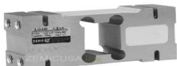
Рисунок 15 - Общий вид датчиков серии L6F