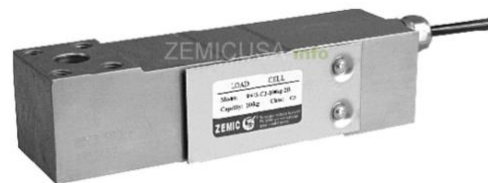
Рисунок 2 - Общий вид датчиков серий В6ЕЗ, В6Г, Н6Г, Н6ЕЗ