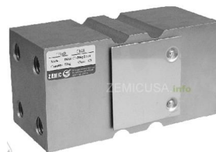
Рисунок 4 - Общий вид датчиков серий В6Г5, Н6Г5