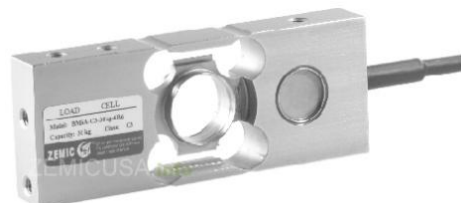
Рисунок 8 - Общий вид датчиков серии ВМ6А