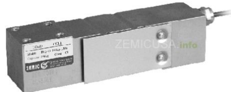
Рисунок 6 - Общий вид датчиков серий В6Q, L6Q