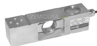
Рисунок 24 - Общий вид датчиков серии VM6E