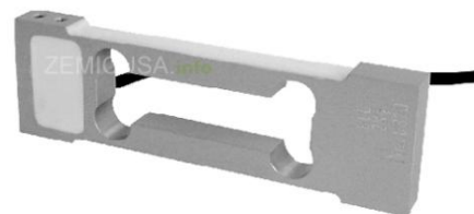
Рисунок 10 - Общий вид датчиков серии L6B