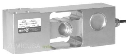
Рисунок 9 - Общий вид датчиков серии VM6G