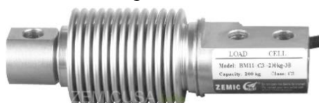
Рисунок 7 - Общий вид датчиков серий ВМ11, НМ11