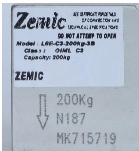
Рисунок 25 – Пример маркировки датчиков

Пломбирование датчиков не предусмотрено. Защита от несанкционированного доступа достигается путём применения лазерной сварки и герметика на этапе производства датчиков. Ограничение доступа обеспечивается конструкцией самих датчиков, вскрытие которой приводит к её разрушению.