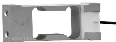
Рисунок 17 - Общий вид датчиков серии L6H5