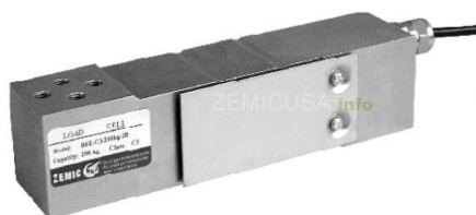
Рисунок 1 - Общий вид датчиков серий В6Е, Н6Е

Датчики выполняются в 32 сериях, общий вид которых представлен на рисунках 1 - 24. Пример маркировки датчиков представлен на рисунке 25.