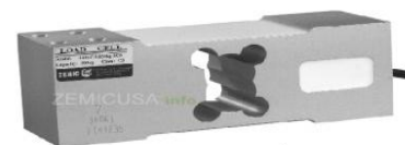
Рисунок 16 - Общий вид датчиков серии L6G