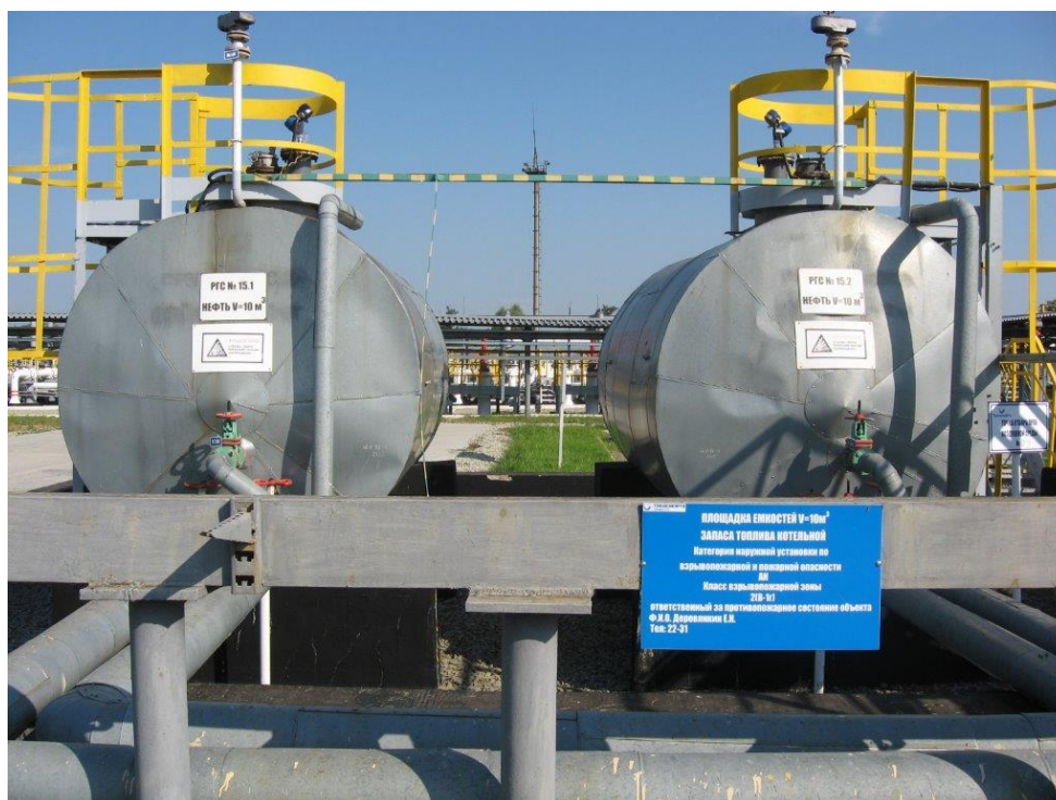
Рисунок 1 - Общий вид резервуаров РГС-10 № 5, 6

Общий вид резервуаров стальных горизонтальных цилиндрических РГС-10, РГС-40 представлен на рисунках 1-7.