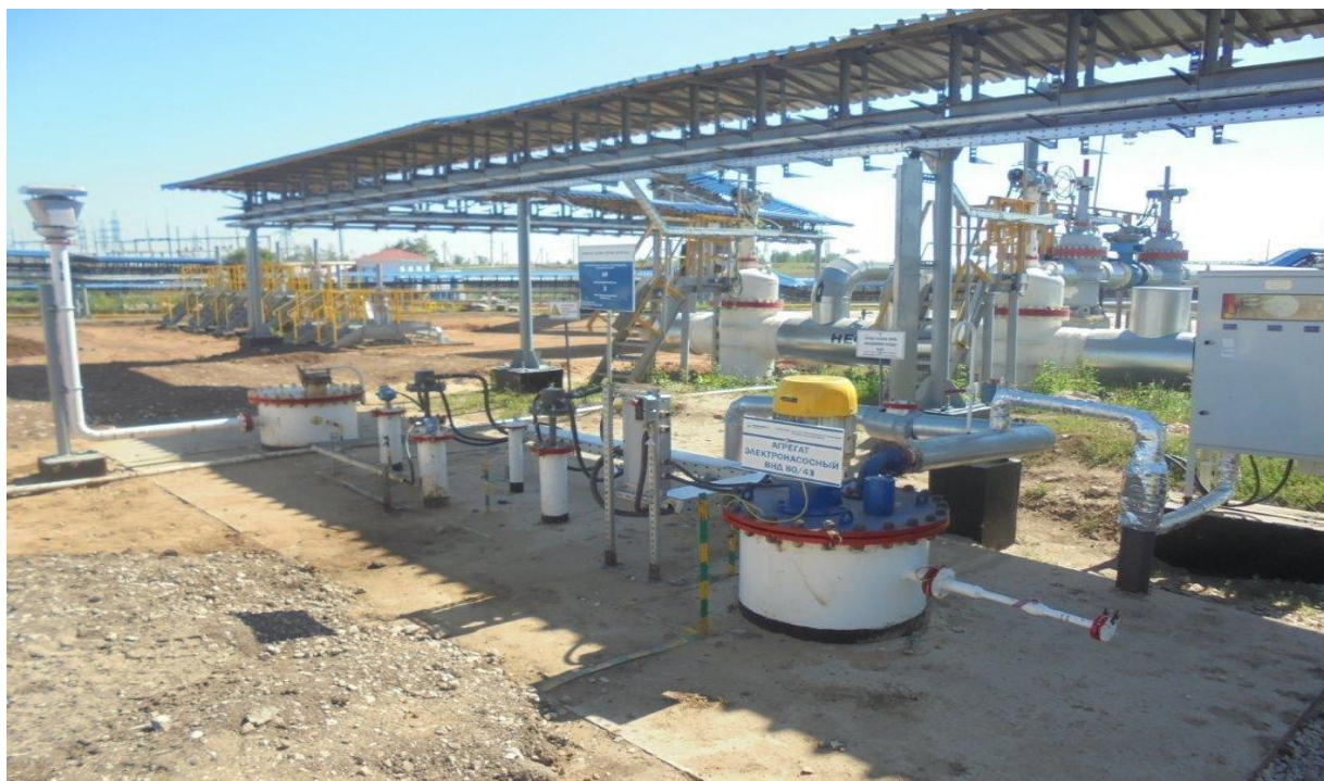
Рисунок 1 - Общий вид места установки резервуара

Общий вид места установки и эскиз резервуара горизонтального стального цилиндрического РГС-40 представлен на рисунках 1-2.