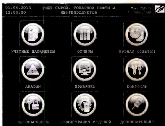
Рисунок 1 – Идентификационные данные ПО

8.5.1.2 Проверку идентификационного наименования и номера версии ПО ИВК проводят сравнением данных, приведённых в 8.5.1.1 настоящей МП и отображаемых в верхнем правом углу главного окна дисплея ИВК (рисунок 1).