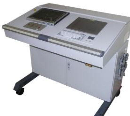
г) пульт управления