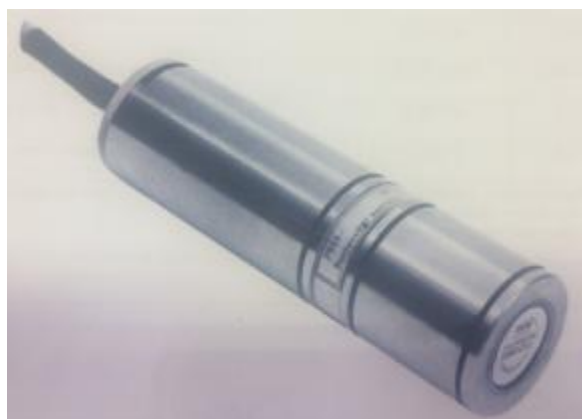
а) преобразователь силоизмерительный 7935/2К-5кН