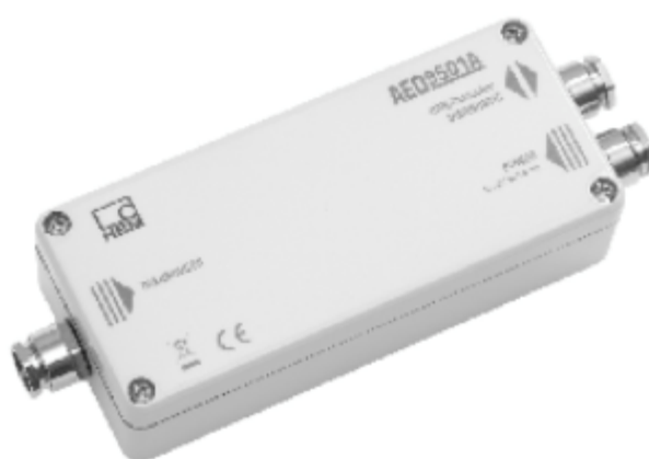
б) устройство обработки аналоговых данных AED9401A