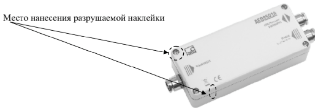
Рисунок 3 - Схема пломбировки устройства обработки аналоговых данных AED9401A