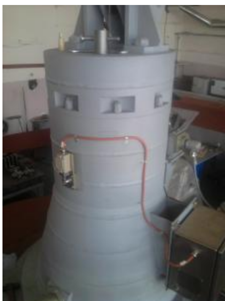
в) биозащитный корпус устройства перегрузочного M056A.02.00.000