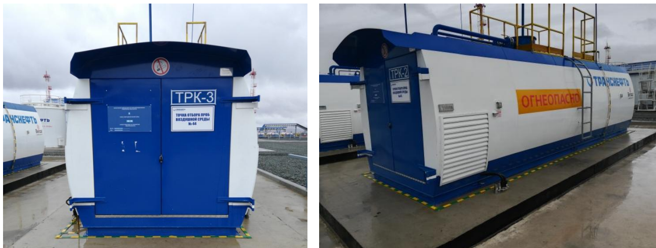
Рисунок 1 - Общий вид резервуаров РГСД-20 №№ 966, 967, 968