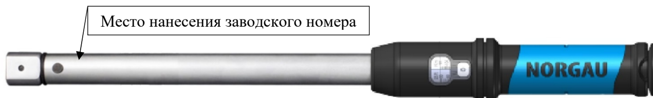
Рисунок 3 – Общий вид ключей моментных предельных NTWZ-XI