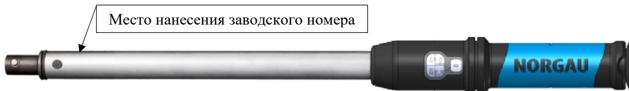
Рисунок 4 – Общий вид ключей моментных предельных NTWZ-XC