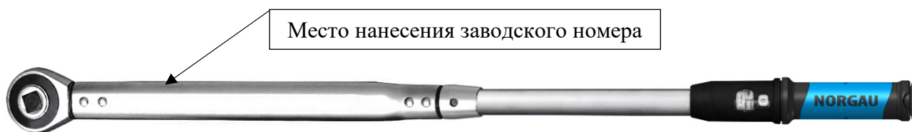
Рисунок 2 – Общий вид ключей моментных предельных NTW44-XRL