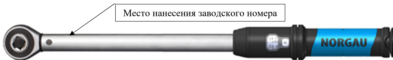
Рисунок 1 – Общий вид ключей моментных предельных NTW40/41/42/43-XRL

Общий вид ключей представлен на рисунках 1 - 7.