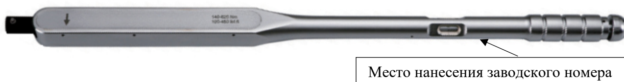
Рисунок 7 – Общий вид ключей моментных предельных NTWA-XC