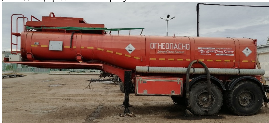
Рисунок 1 – Общий вид ПЦ.