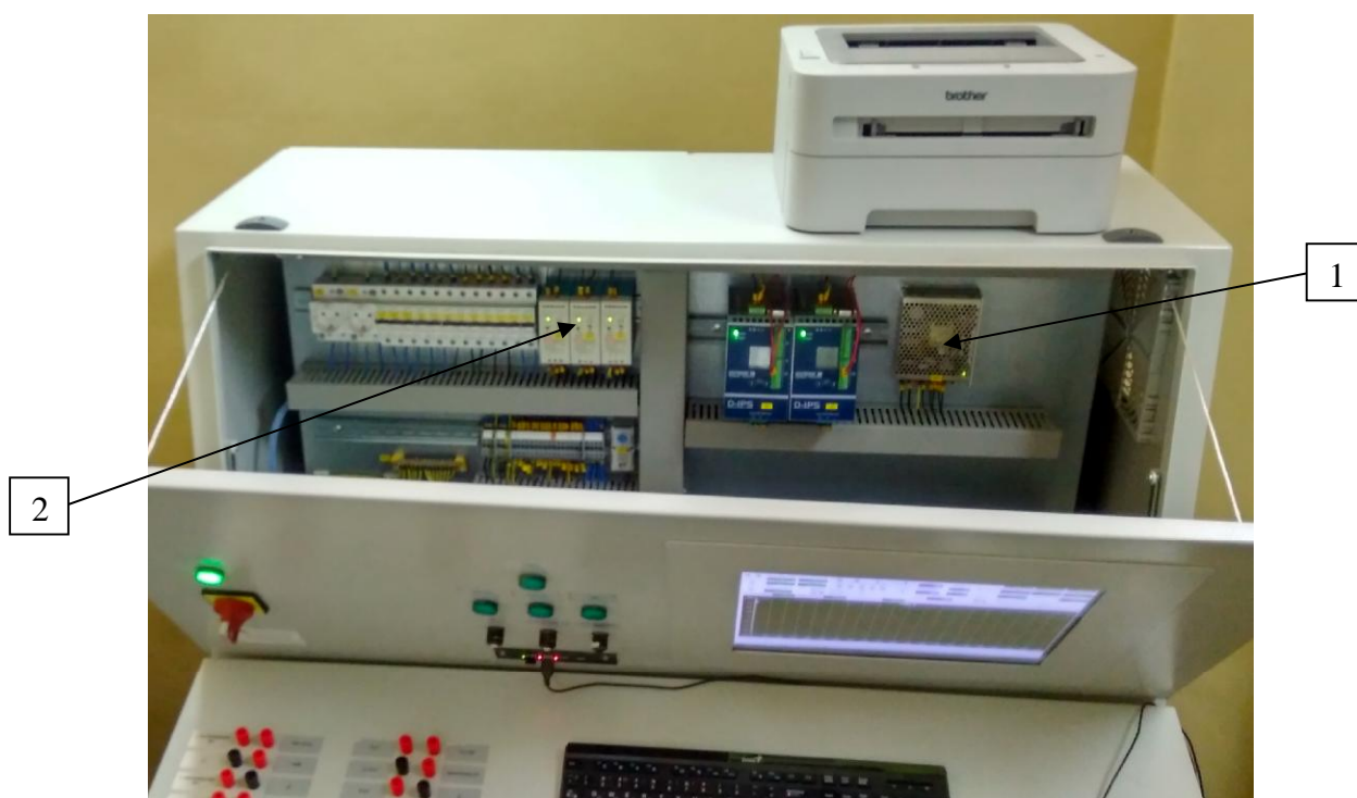
1 – источник питания Т-40С; 2 – источники питания MDR-60-34 Рисунок 3 – Внутреннее устройство системы – верхний отсек