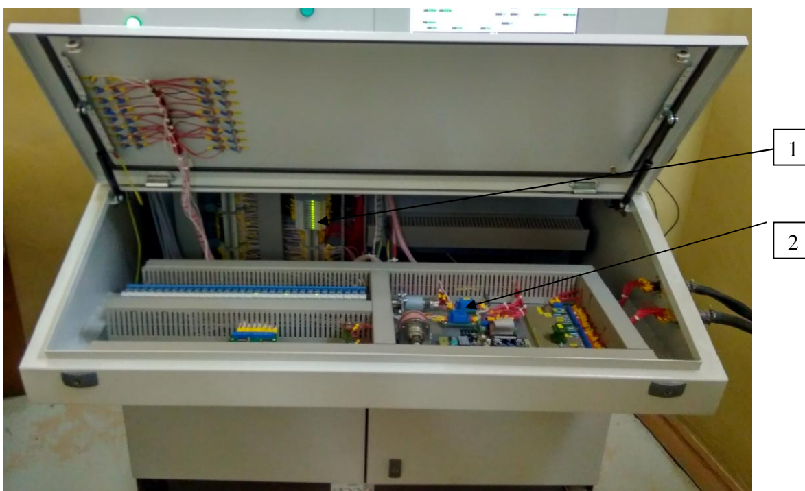
1 – модули электронные WAD-A-MAX; 2 – датчики тока LA25-NP/SP44 с резисторами прецизионными SMD1206