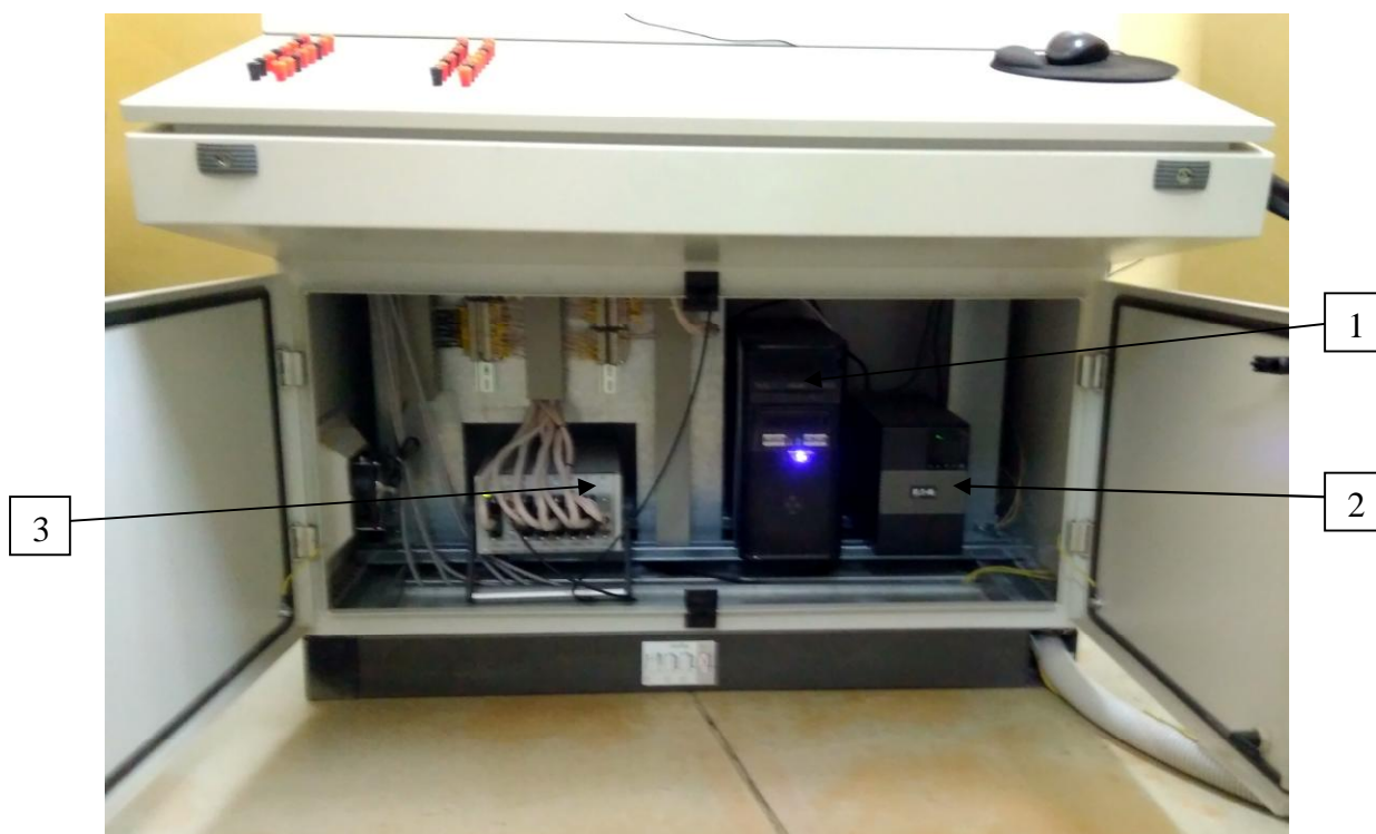
1 – ПК Intel Pentium G3420; 2 – источник бесперебойного питания EATON Evolution 650; 3 – установка измерительная LTR-EU-8-1