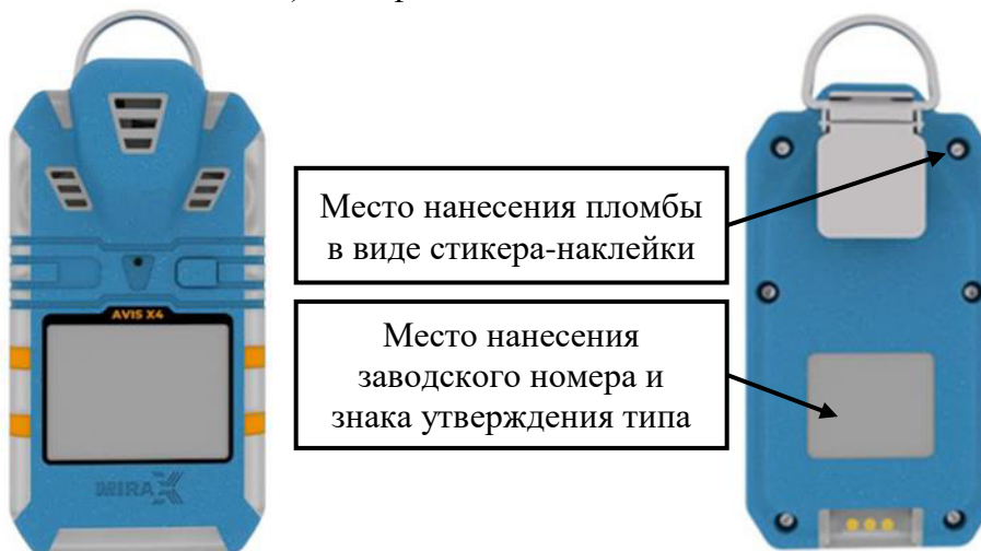
в) модификация AVIS X4