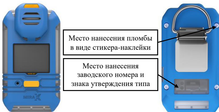
а) модификация AVIS X1