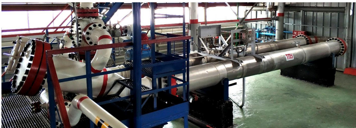
Рисунок 1 – Общий вид установки поверочной трубопоршневой двунаправленной Smith-550