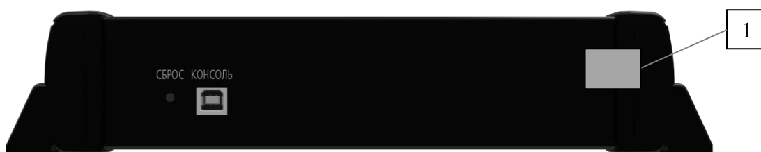
Рисунок 2 – Общий вид анализаторов. Панель верхняя