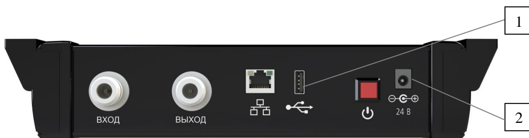
Рисунок 1 – Общий вид анализаторов. Вид спереди