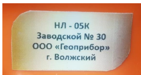
Рисунок 2 – Маркировка нивелиров лазерных НЛ-05К