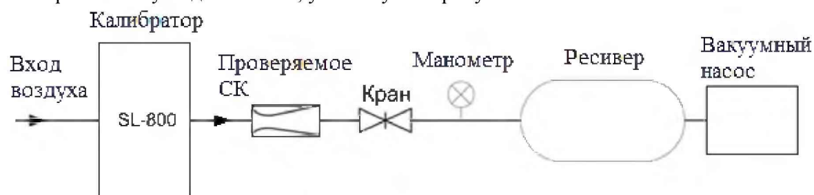
Рисунок 1. Схема подключений СК к ЭУ-5

Собирают схему подключений, указанную на рисунке 1.