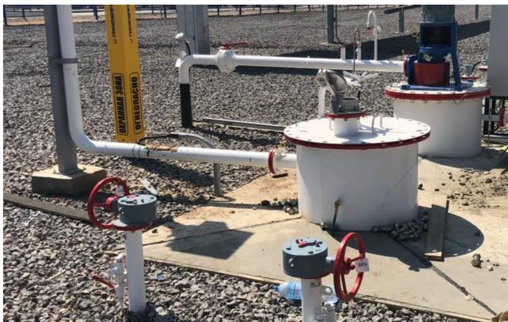
Рисунок 1 - Общий вид места установки резервуара стального горизонтального цилиндрического РГС-100 зав. № 6966

Общий вид мест установки резервуара стального горизонтального цилиндрического представлен на рисунке 1. Эскиз резервуара стального горизонтального цилиндрического представлен на рисунке 2.