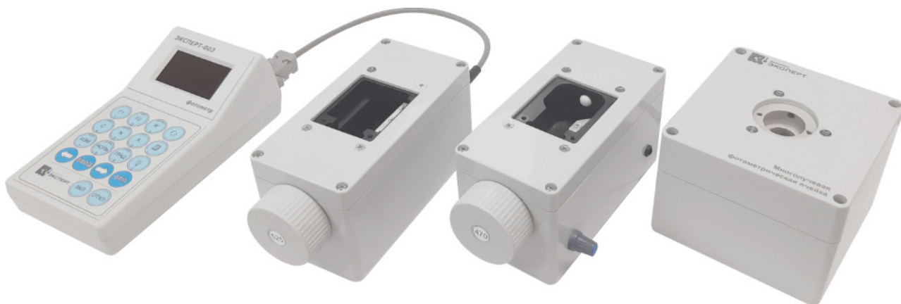
Рисунок 1 – Общий вид фотометров модификации ЭКСПЕРТ-003-1

Место пломбирования, место нанесения знака утверждения типа и схема маркировки представлены на рисунке 4.