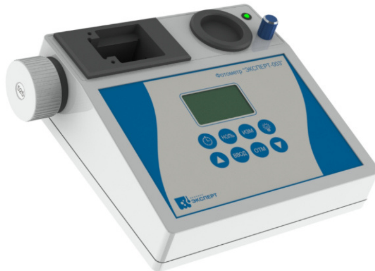
Рисунок 3 – Общий вид фотометра модификации ЭКСПЕРТ-003-3