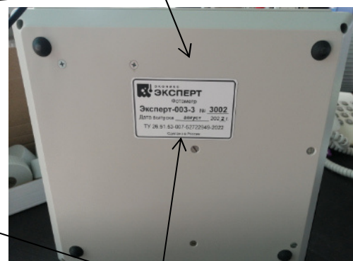
Схема маркировки и место нанесения заводского номера