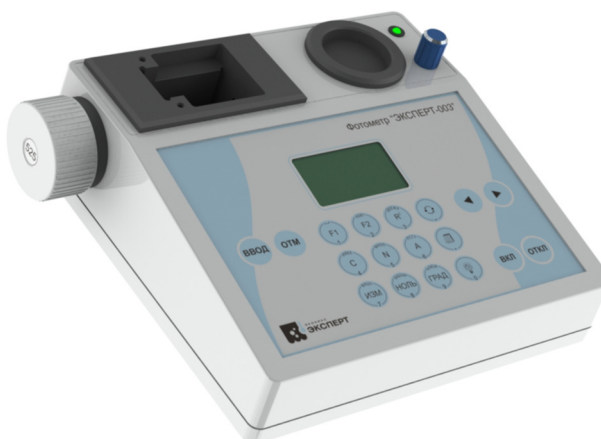
Рисунок 2 – Общий вид фотометров модификации ЭКСПЕРТ-003-2