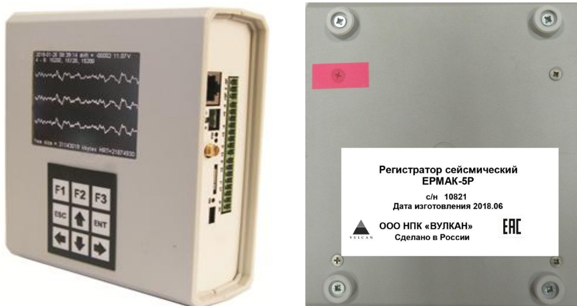
Рисунок 1 - Общий вид регистраторов сейсмических ЕРМАК-5Р

Место опломбирования приведено на рисунке 3.