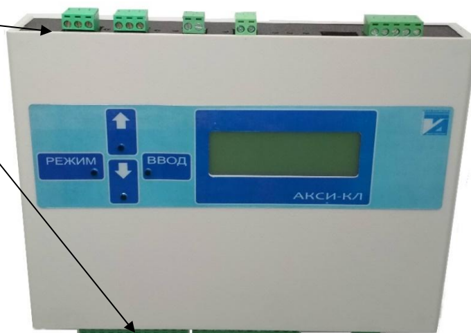
б) автоматы АКСИ-КЛ

Места пломбирования от несанкционированного доступа