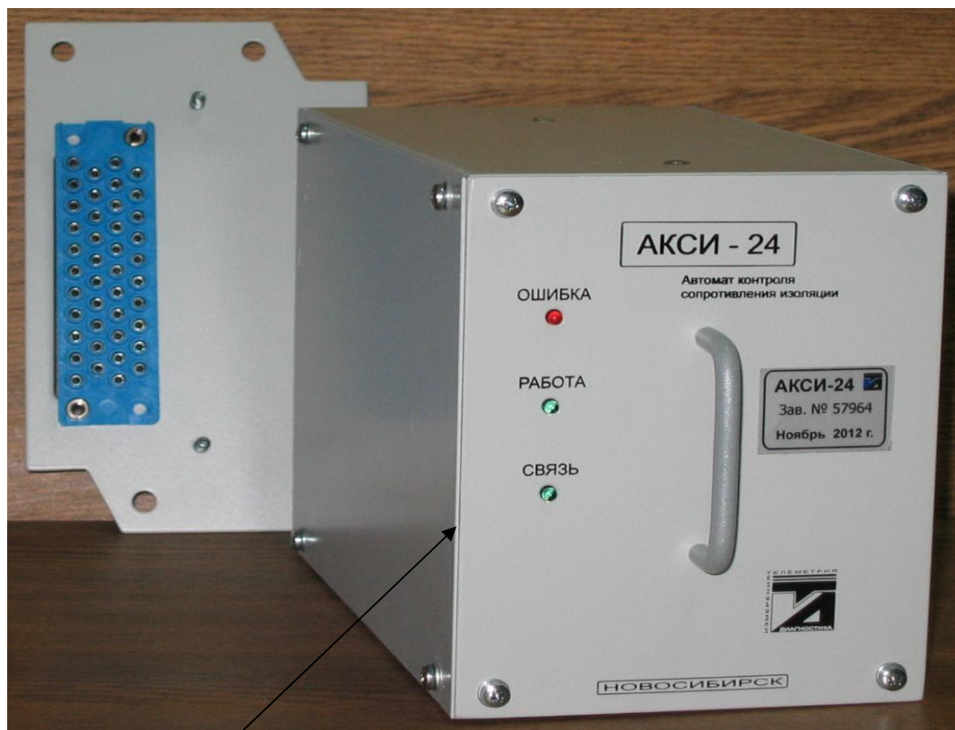
а) автоматы АКСИ-24

Место пломбирования от несанкционированного доступа