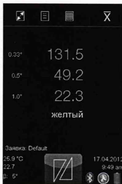
Рисунок 3 – Вид экрана ретрорефлектометра после проведения измерения.

8.4.1.3 Для измерения коэффициента световозвращения R_A , кд/(м 2 ·лк), нажать измерительный курок. Результаты измерений коэффициента световозвращения отображаются на экране рядом с каждым углом наблюдения как показано на рисунке 3.