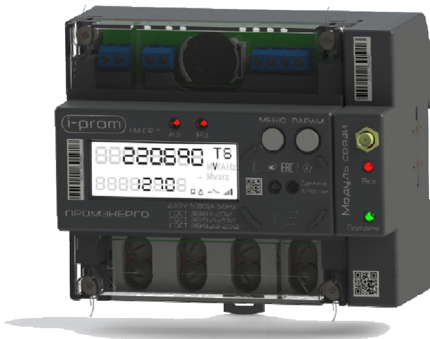
Рисунок 1 - Общий вид счетчиков электрической энергии однофазных многофункциональных i-prom.1

Схема пломбировки от несанкционированного доступа, обозначение мест нанесения заводского номера и знака утверждения типа представлены на рисунке 2.