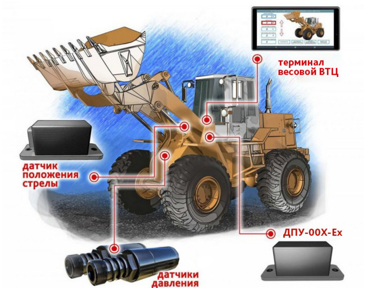
Рисунок 2 — Примеры (схемы) размещения частей средства измерений, смонтированного на ковшом или вилочном погрузчике