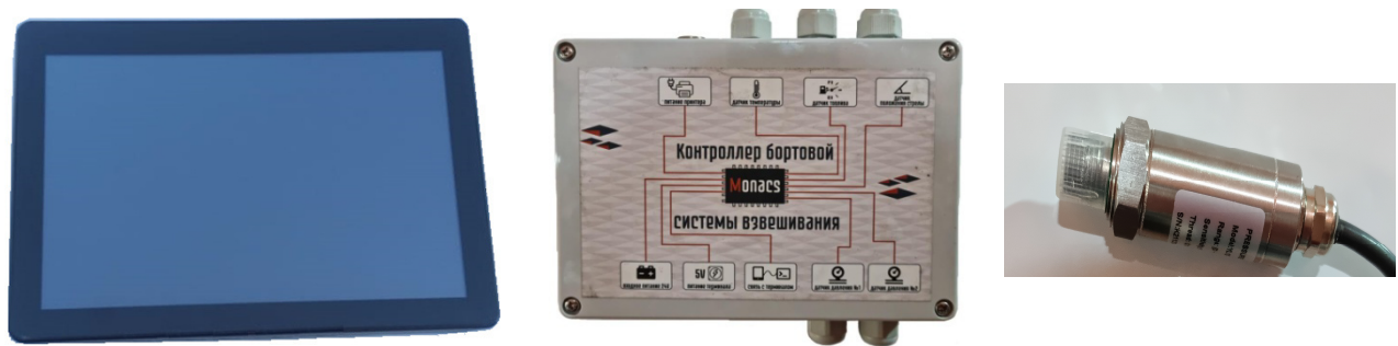
Рисунок 1 — Общий вид частей средства измерений: весовой терминал ВТЦ (слева), динамический преобразователь ДПУ-00Х-Ех (в центре), первичный преобразователь (справа)

где [M] – максимальная нагрузка Max, кг: 1000, 2000, 3000, 4000, 5000, 8000, 10000, 12000, 15000, 20000.