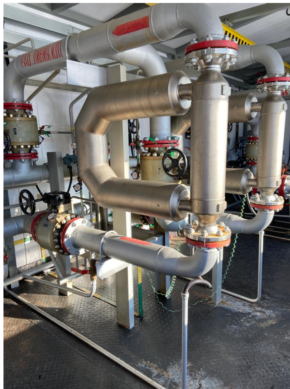
Рисунок 1 – Общий вид счетчиков-расходомеров