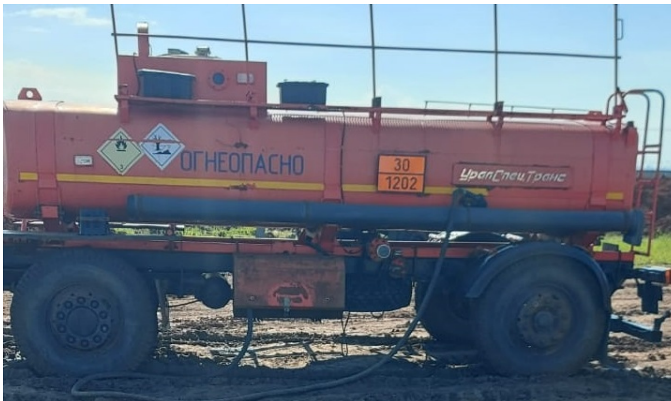
Рисунок 5 – Общий вид прицепа-цистерны УСТ 94651J зав.№ Z0V94651JC5000019