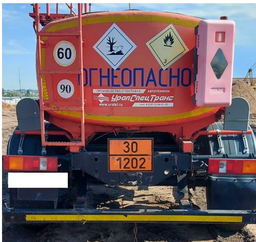
Рисунок 6 – Общий вид прицепа-цистерны УСТ 94651J зав.№ Z0V94651JC5000019

Схема пломбировки для защиты от несанкционированного изменения положения уровня налива, обозначение места нанесения знака поверки представлены на рисунке 7.