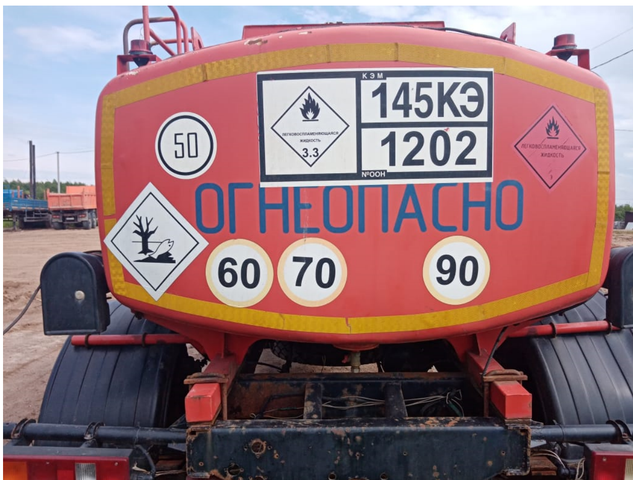
Рисунок 2 – Общий вид прицепа-цистерны УСТ 94651J зав.№ X8994651JB0UST004