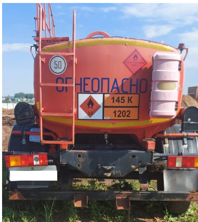
Рисунок 4 – Общий вид прицепа-цистерны УСТ 94651J зав.№ X8994651JC0UST006