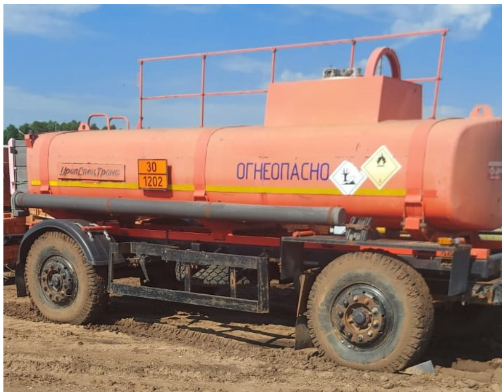
Рисунок 3 – Общий вид прицепа-цистерны УСТ 94651J зав.№ X8994651JC0UST006