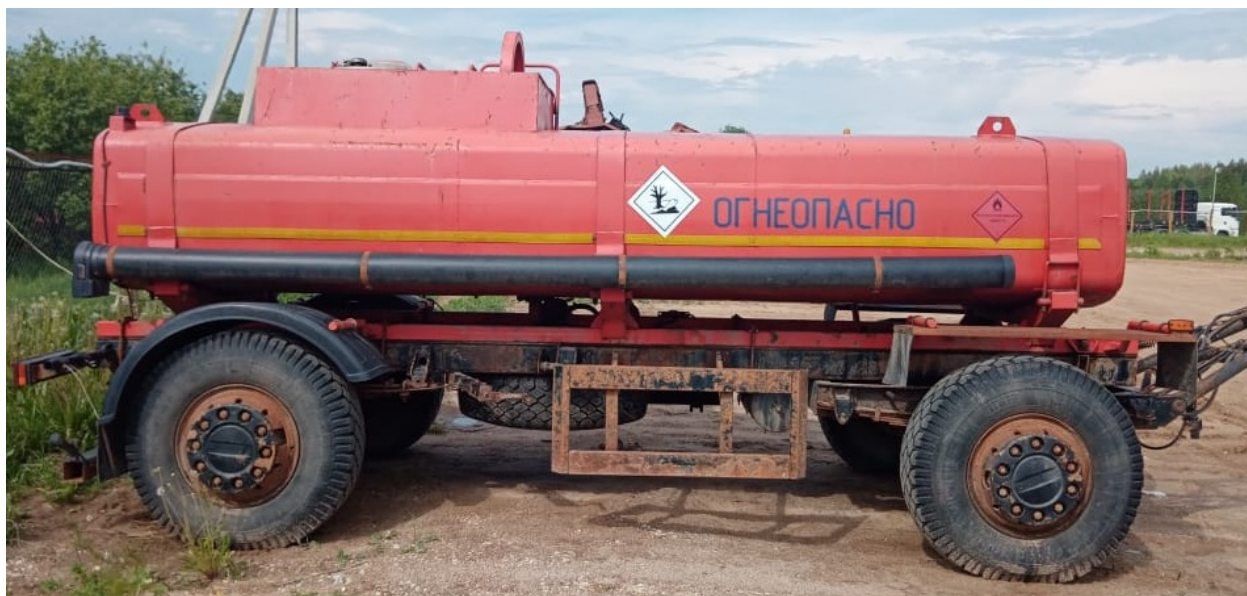
Рисунок 1 – Общий вид прицепа-цистерны УСТ 94651J зав.№ X8994651JB0UST004