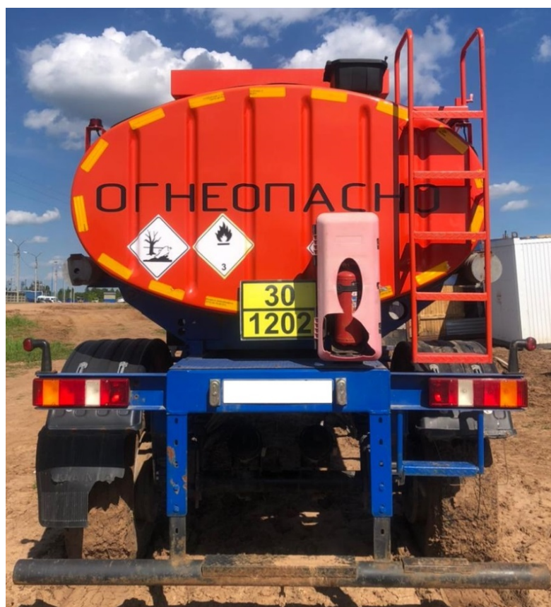
Рисунок 2 – Общий вид прицепа-цистерны 4679P4-10

Схема пломбировки для защиты от несанкционированного изменения положения уровня налива, обозначение места нанесения знака поверки представлены на рисунке 3.