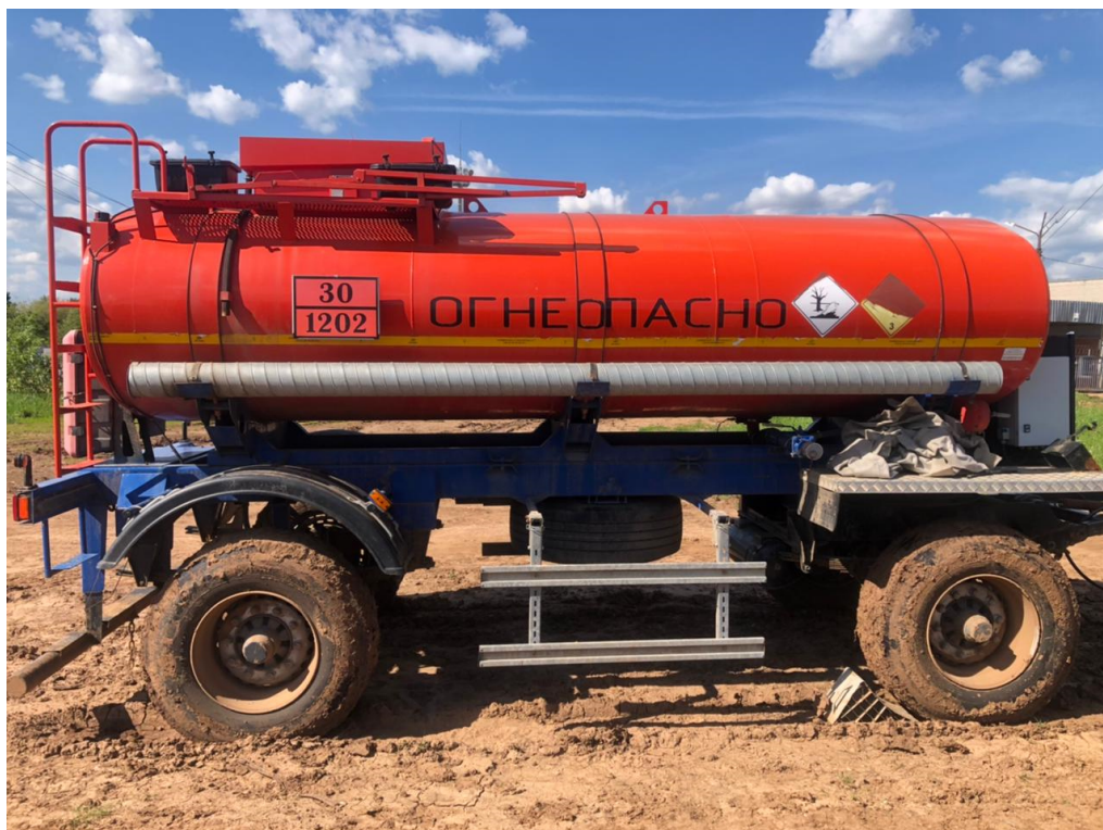
Рисунок 1 – Общий вид прицепа-цистерны 4679P4-10