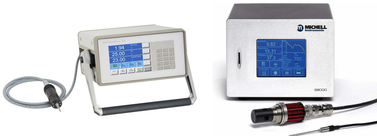
Рисунок 2 - Внешний вид контрольных конденсационных гигрометров 473-RP2 Dew Point Mirror (слева) и Michell Instruments S8000 Remote (справа), входящих в состав генераторов модификаций Humiwell-473 и Humiwell-S8000

Внешний вид контрольных гигрометров, входящих в комплект модификаций Humiwell-473 и Humiwell-S8000 приведен на рисунке 2.