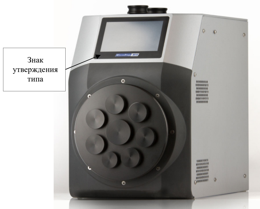
Рисунок 1- Внешний вид генератора влажного газа Humiwell, модификации Humiwell

Внешний вид генератора Humiwell, модификации Humiwell, с указанием места нанесения знака утверждения типа приведен на рисунке 1.