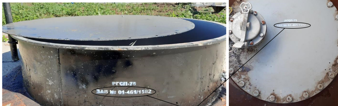
Места нанесения заводского номера