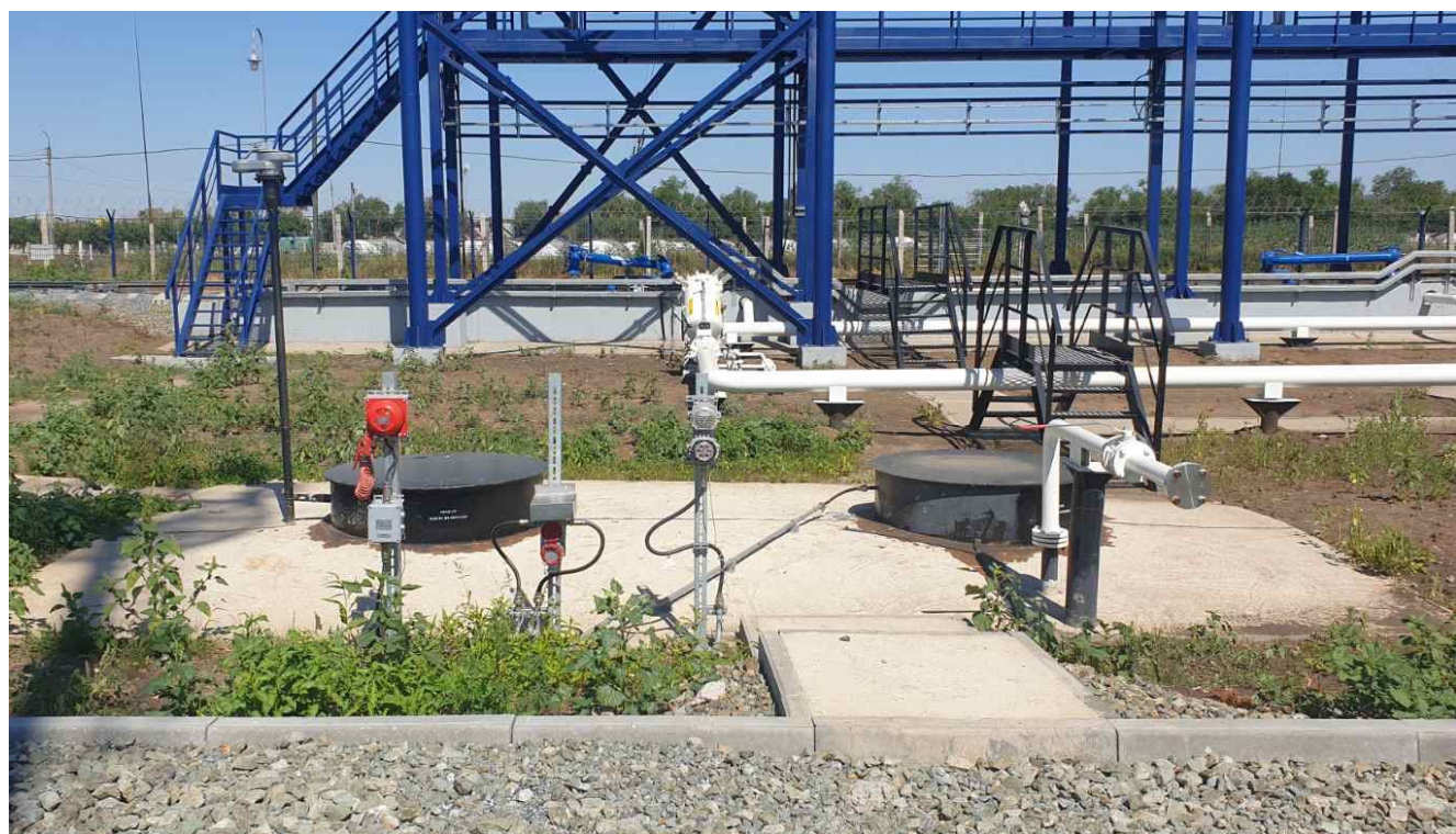
Рисунок 2 – Общий вид резервуара РГСП-75