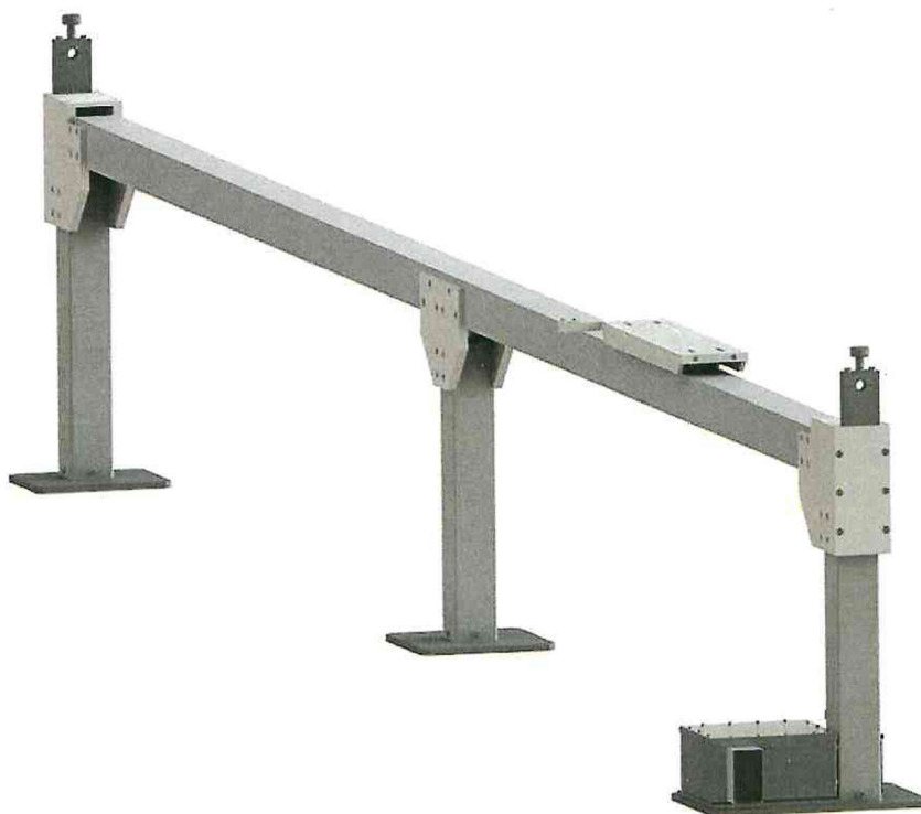
Рисунок А.1 – Компаратор

Компаратор для поверки рулеток 2 и 3-го классов точности по образцовой измерительной ленте 3-го разряда представляет собой горизонтальный стол соответствующей длины с приспособлениями для закрепления начальных концов лент рулеток и совмещения нулевых отметок их шкал, а также блоками и струнами с грузами для натяжения рулеток. Сравнение общей длины и отдельных интервалов поверяемой рулетки с соответствующими интервалами образцовой измерительной ленты проводят при помощи лупы ЛИ-4 с увеличением 10× или микроскопа типа МИР-2 с ценой деления 0,01 мм.