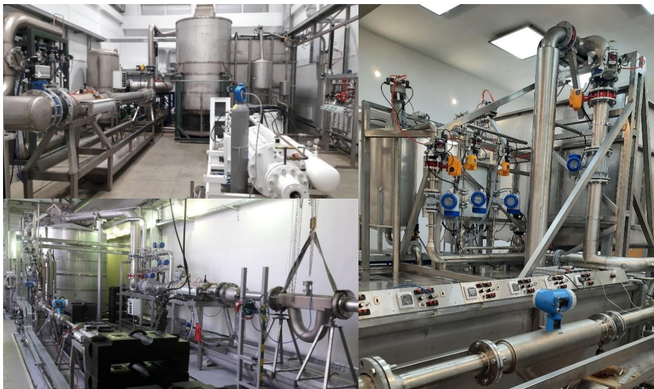
Рисунок 1 – Общий вид установок

Пломбировка установок осуществляется с помощью свинцовой (пластмассовой) пломбы и проволоки, которой пломбуются фланцевые соединения расходомеров установки (при их наличии), с нанесением знака поверки на пломбу. При отсутствии расходомеров в составе установки пломбирование установок не предусмотрено.