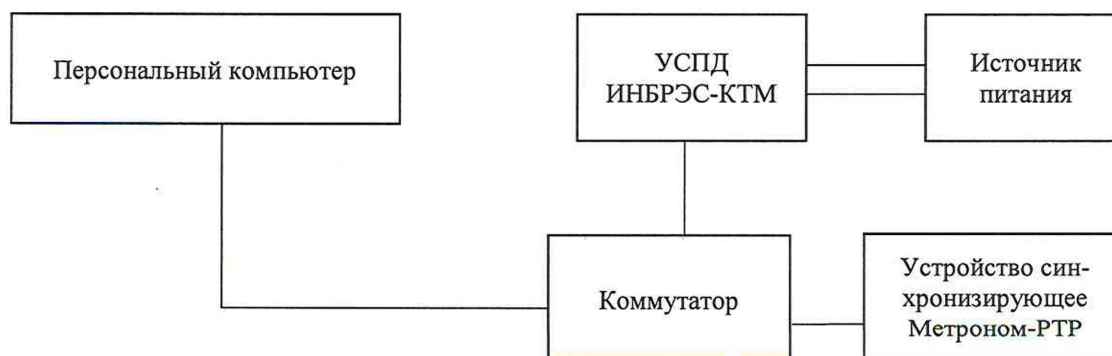
Рисунок 1 – Схема подключения

2) Собрать схему, представленную на рисунке 1.