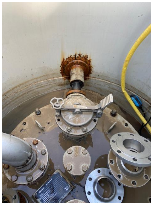
Рисунок 2 – Горловины и замерный люк резервуара.