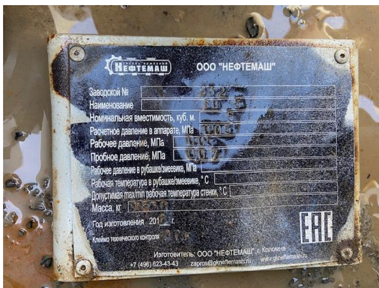
Рисунок 3 – Заводской номер резервуара .

Пломбирование резервуара не предусмотрено.