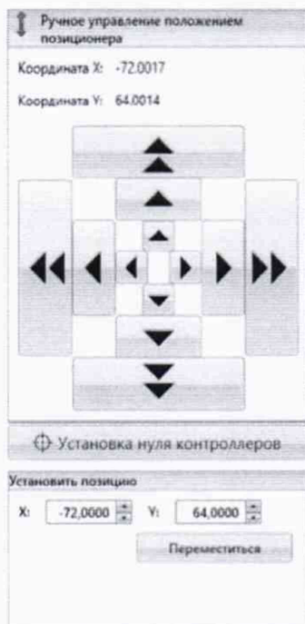
Рисунок 2 – Меню программы для ручного управления движением сканера

Перемещая антенну-зонд с установленным оптическим отражателем вдоль осей Ox и Oz (горизонтальная плоскость сканирования) в пределах рабочей зоны сканера с шагом \lambda_{min}/2 (где \lambda_{min} - минимальная длина волны, соответствующая верхней границе диапазона рабочих частот комплекса, до срабатывания механического ограничителя), фиксировать показания системы Leica Absolute Tracker AT401.