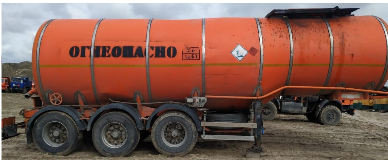
Рисунок 1 – Общий вид ППЦ