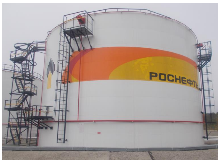
Рисунок 2 – Общий вид резервуаров РВСП-3000

Пломбирование резервуаров не предусмотрено. Знак поверки наносится на свидетельство о поверке и градуировочную таблицу.