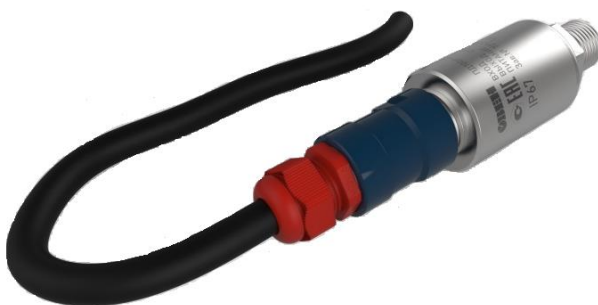
Рисунок 6 – Общий вид преобразователей давления измерительных ПД180 с типом электрического подключения RJ