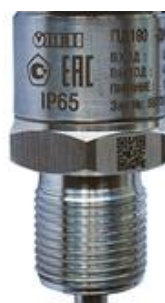
Рисунок 10 – Общий вид преобразователей давления измерительных ПД180 со способом присоединения к измерительному процессу с помощью резьбы по ГОСТ 8724-2002, ГОСТ 6357-81, ГОСТ 6211-81