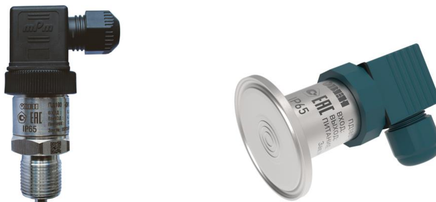
Рисунок 2 – Общий вид преобразователей давления измерительных ПД180 с типом электрического подключения А1

Нанесение знака поверки на преобразователи в обязательном порядке не предусмотрено.