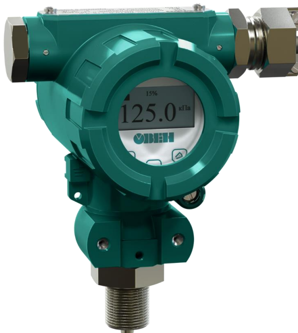
Рисунок 8 – Общий вид преобразователей давления измерительных ПД180 с исполнением корпуса и типом электрического подключения КИ1