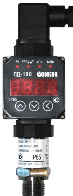
Рисунок 9 – Общий вид преобразователей давления измерительных ПД180 с исполнением корпуса и типом электрического подключения КИ2