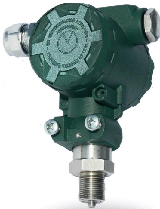
Рисунок 7 – Общий вид преобразователей давления измерительных ПД180 с исполнением корпуса и типом электрического подключения К1