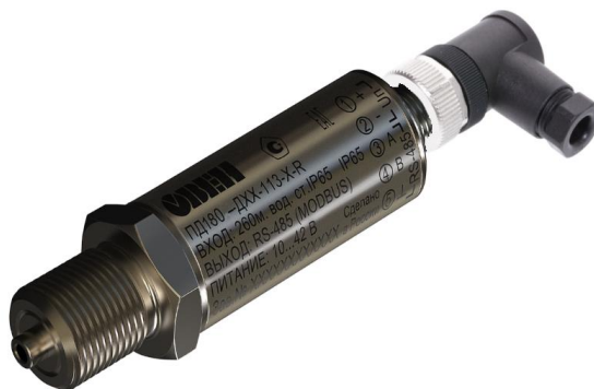
Рисунок 4 – Общий вид преобразователей давления измерительных ПД180 с типом электрического подключения В2