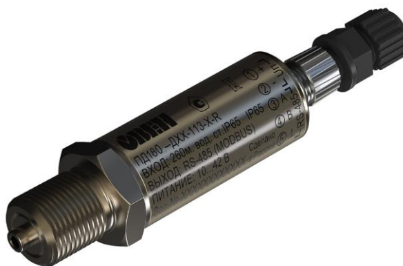
Рисунок 3 – Общий вид преобразователей давления измерительных ПД180 с типом электрического подключения В1