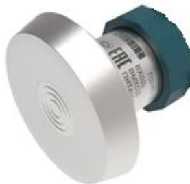
Рисунок 12 – Общий вид преобразователей давления измерительных ПД180 со способом присоединения к измерительному процессу в соответствии с DIN 11851

Пломбирование преобразователей не предусмотрено.