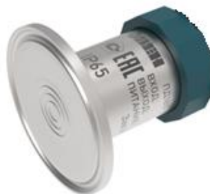
Рисунок 11 – Общий вид преобразователей давления измерительных ПД180 со способом присоединения к измерительному процессу в соответствии с DIN 32676