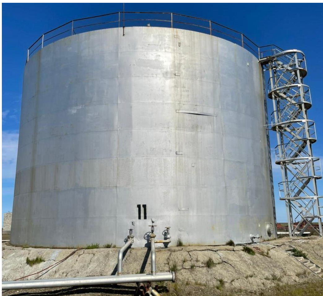
Рисунок 1 – Общий вид резервуара РВС-3000 с заводским номером 11