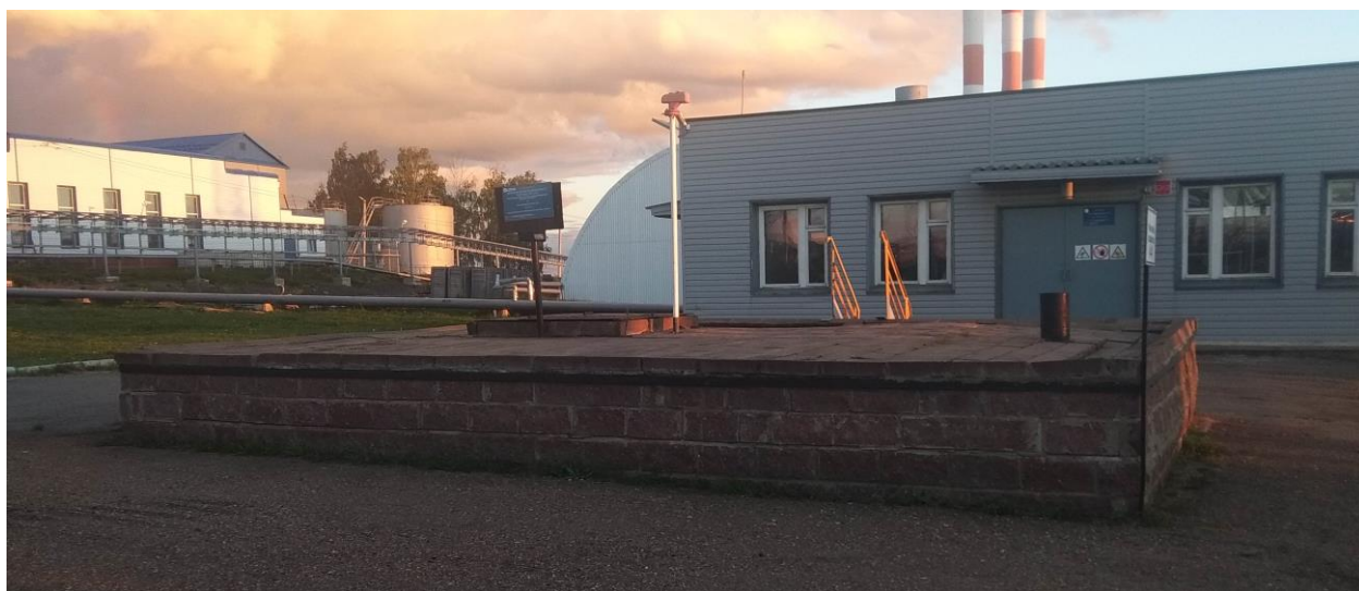
Рисунок 1 – Общий вид резервуара РГС-25

Нанесение знака поверки на средство измерений не предусмотрено.