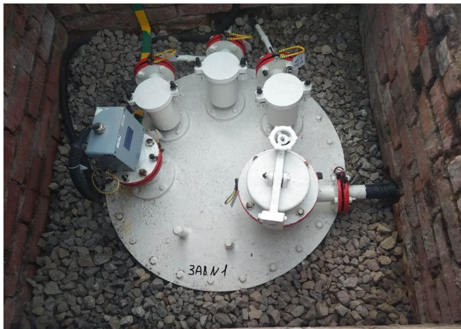
Рисунок 2 – Общий вид резервуара РГС-25