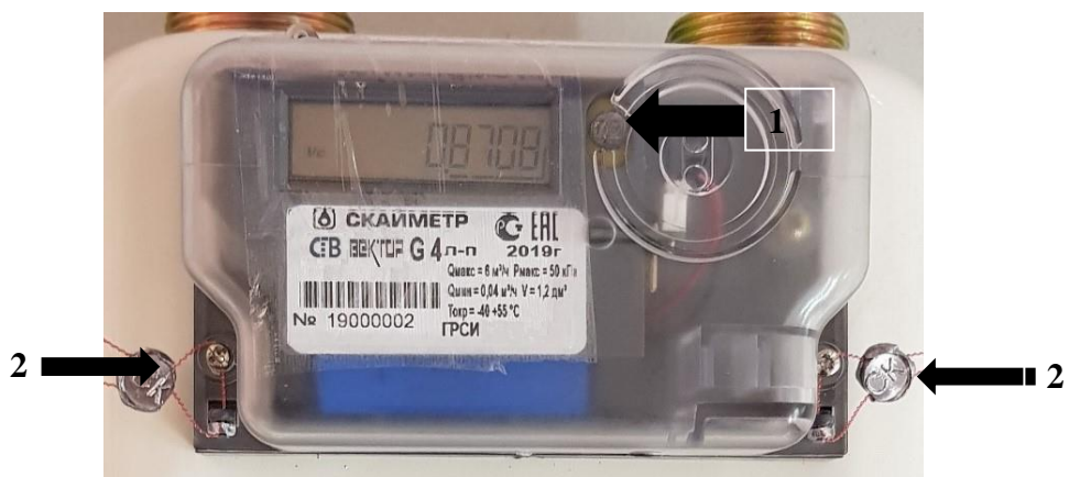
а) исполнения «СГВ-Вектор», «СГВ-Вектор К»