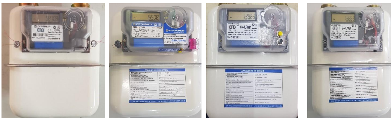
б) исполнения «СГВ-Вектор» и «СГВ-Вектор К»