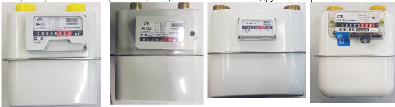
а) исполнения «СГВ-VM» и «СГВ-МТ»

Пломбировку изготовителя или поставщика газа осуществляют с помощью проволоки и свинцовой (пластмассовой) пломбы, специальной мастики или других материалов.