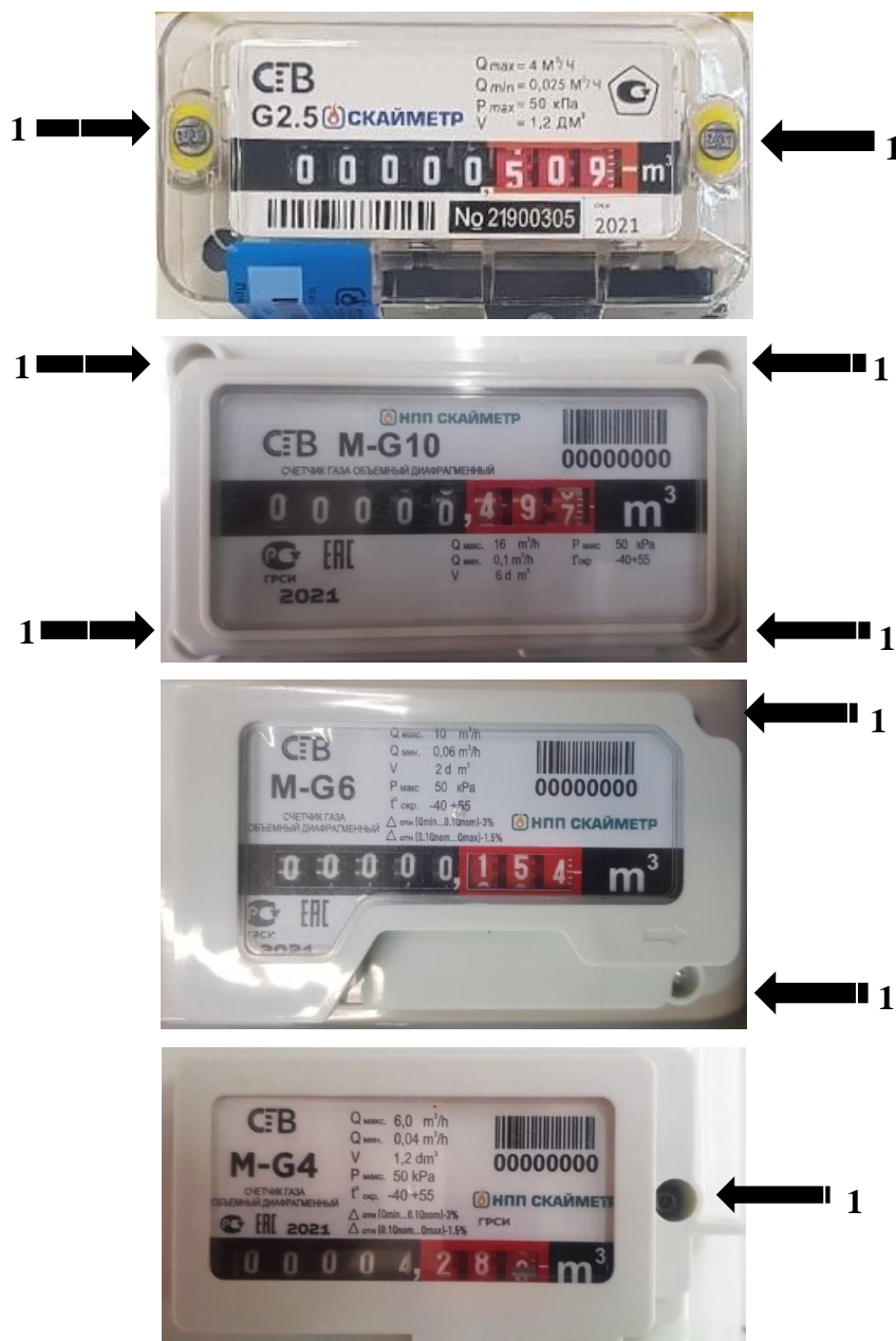
Рисунок 3 – Схема пломбировки от несанкционированного доступа, обозначения места нанесения знака поверки счетчиков газа диафрагменных СГВ в исполнении «СГВ-VM» и «СГВ-MT» (1 – место для установки знака поверки)