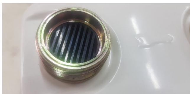
Рисунок 4 – Сетка защитная