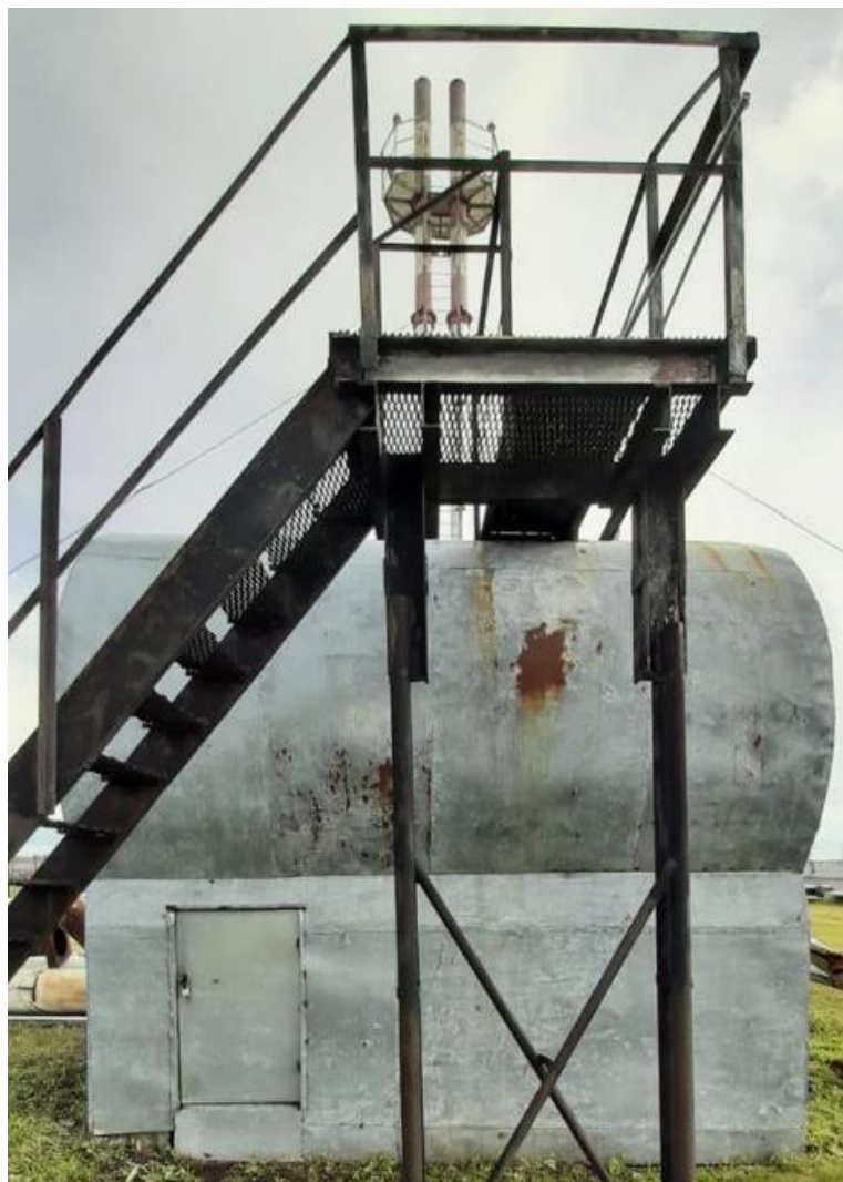
Рисунок 2 – Общий вид резервуара Р-25

Пломбирование резервуара Р-25 не предусмотрено.