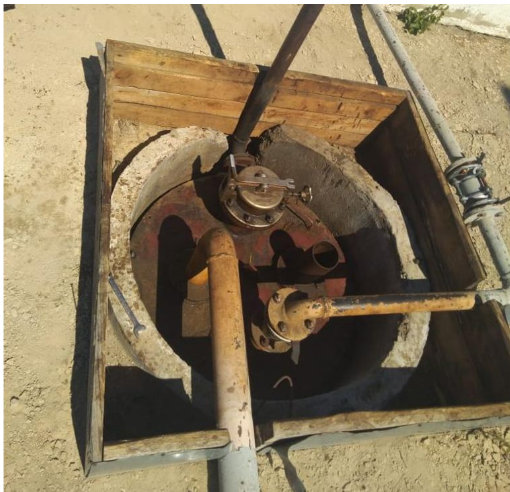
Рисунок 2 – Общий вид резервуара Р-10