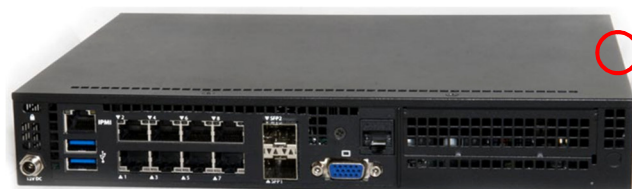
○ – место нанесения защитной этикетки