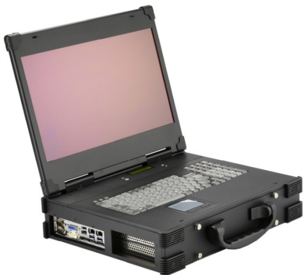
Рисунок 12 – Общий вид Прибора СИГМА-2.МПК2 ПИ