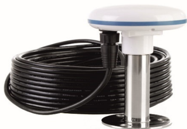
Рисунок 10 – Внешний приемник временной синхронизации