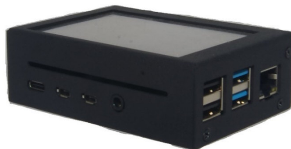
Рисунок 11 – Общий вид Прибора СИГМА-2.УБИ1