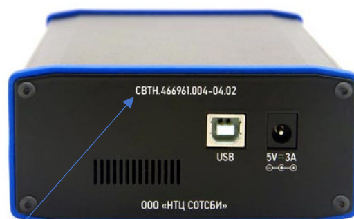
Рисунок 7 – Вид задней панели транспортного модуля СПРС СИГ.СПРС4