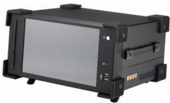
Рисунок 14 – Общий вид Прибора СИГМА-2.РС2