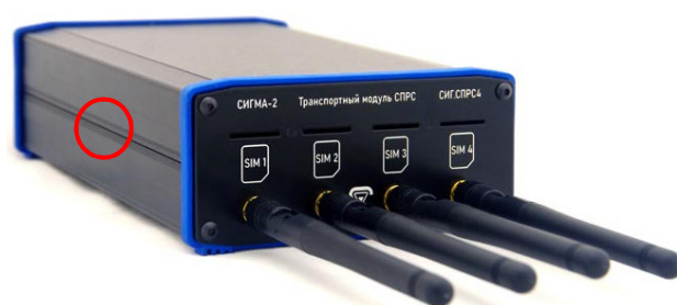
○ – место нанесения защитной этикетки