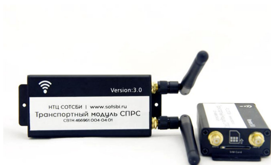
Рисунок 8 – Транспортный модуль СПРС СИГ.СПРС1