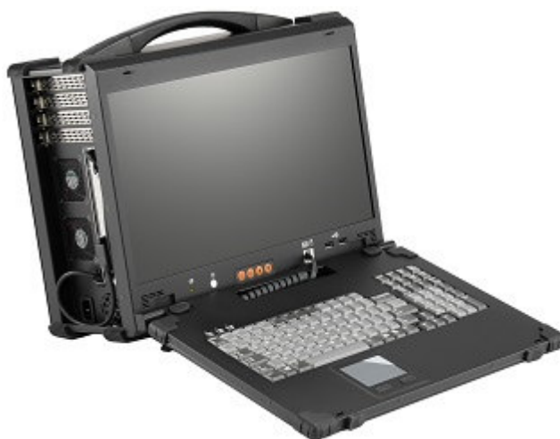
Рисунок 13 – Общий вид Прибора СИГМА-2.РС1