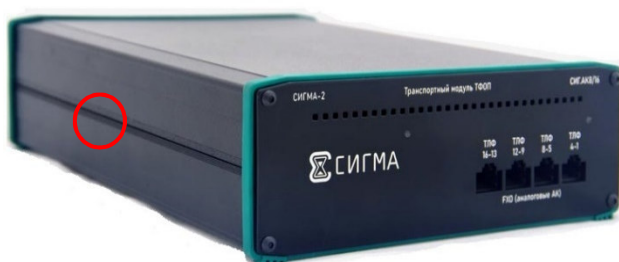
○ – место нанесения защитной этикетки