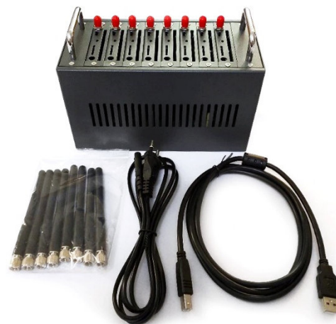
Рисунок 9 – Транспортный модуль СПРС СИГ.СПРС8