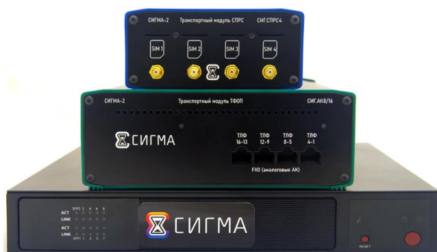
Рисунок 2 – Общий вид Прибора СИГМА-2.МС с транспортными модулями СИГ.СПРС4, СИГ.АК16

Пломбирование транспортных модулей СИГ.СПРС1, СИГ.СПРС8 не предусмотрено.