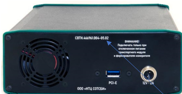
Рисунок 6 – Вид задней панели транспортного модуля ТФОП СИГ.АК8, СИГ.АК16