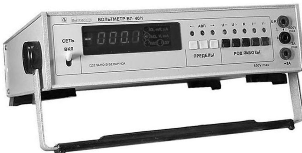
Рисунок 1 – Общий вид вольтметра

Общий вид вольтметра приведен на рисунке 1.