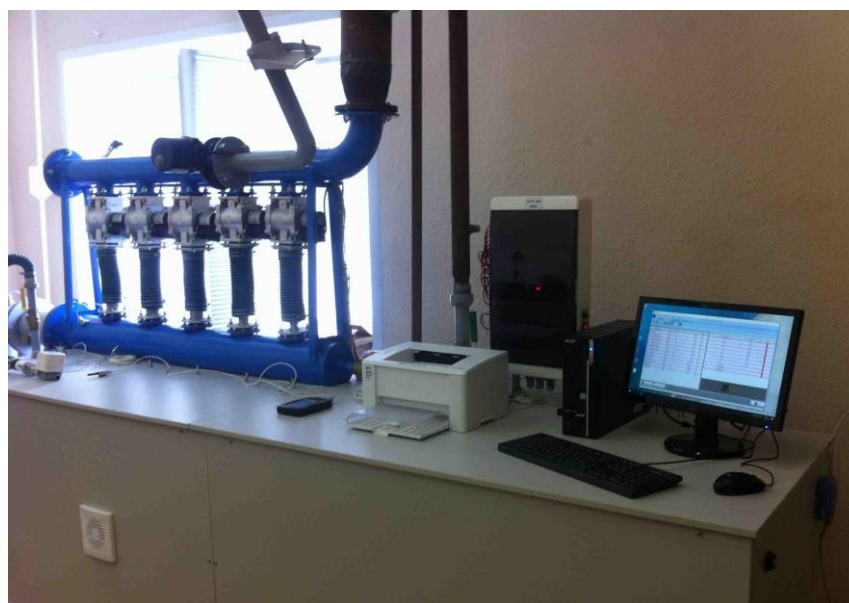
Рисунок 3 – общий вид установок в составе модулей АУРС-К-М и АУРС-К-Б