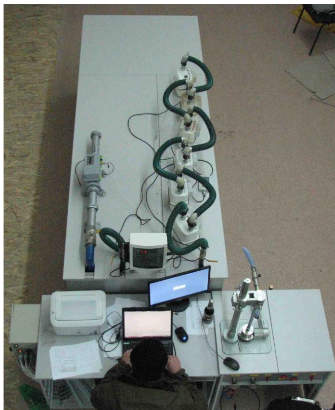
Рисунок 2 – общий вид установок, состоящих из модулей АУРС-К-М