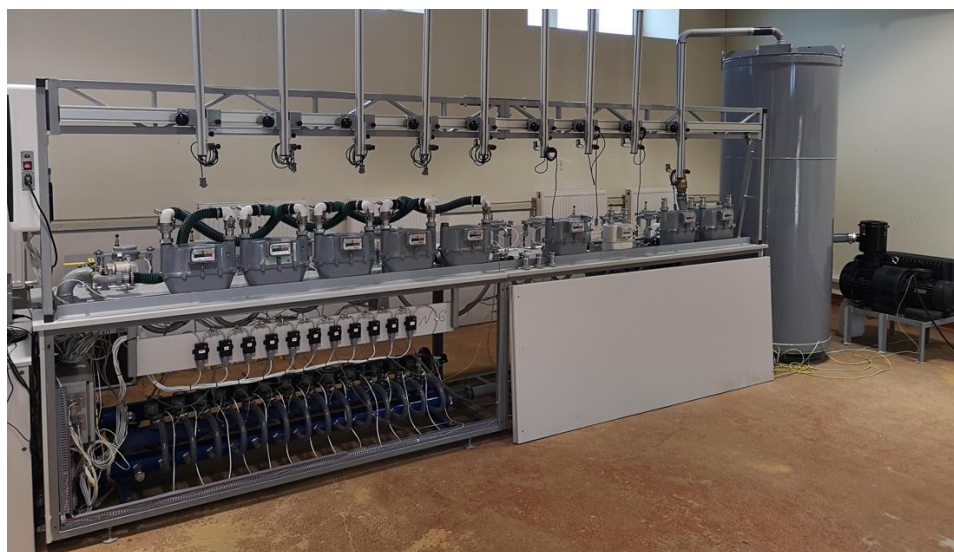
Рисунок 1 – общий вид установок в составе модуля АУРС-К-М с опцией считывания отраженного сигнала от зеркальной метки

Общий вид установок представлен на рисунках 1–2.