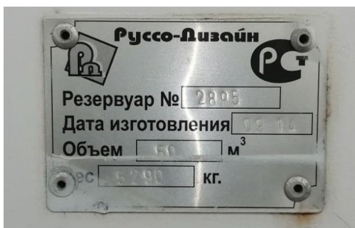
Рисунок 3 – Маркировочная табличка резервуара РГС-50 зав.№ 2895