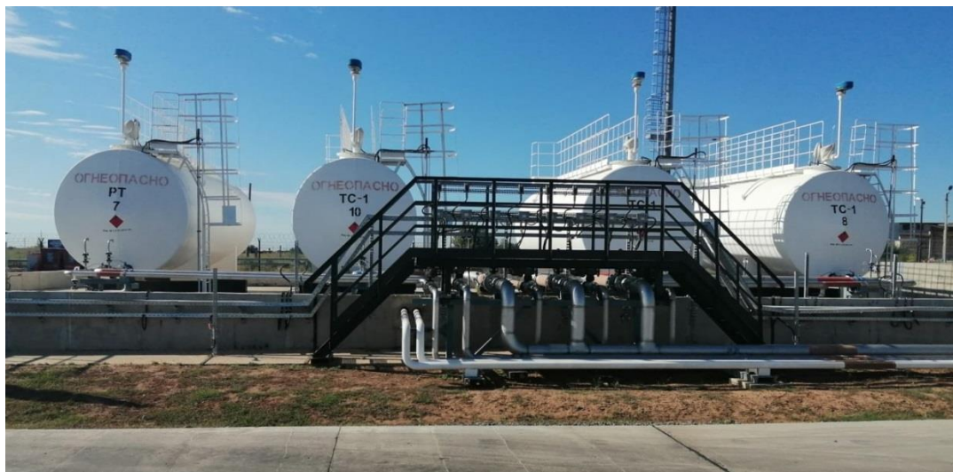
Рисунок 1 – Общий вид резервуаров РГС-50 зав.№№ 2895, 2896, 2897, 2898