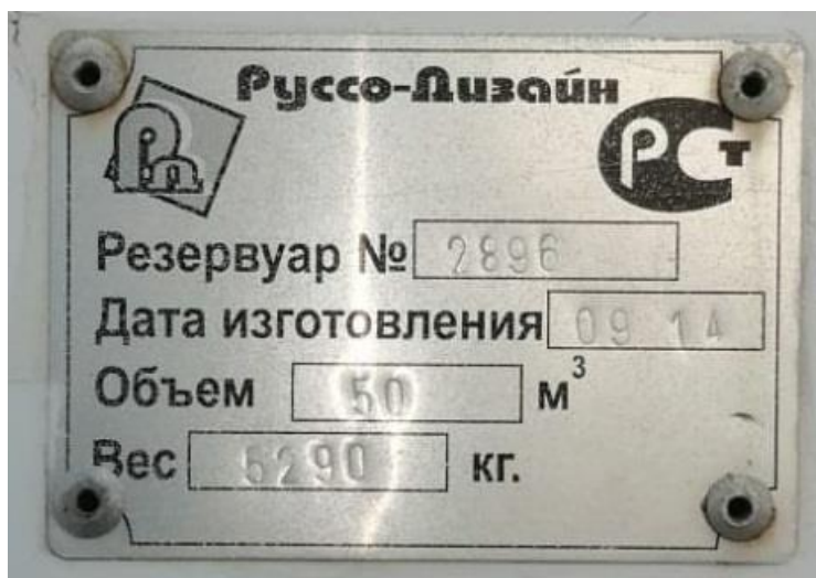
Рисунок 4 – Маркировочная табличка резервуара PTC-50 зав.№ 2896