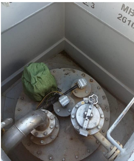
Рисунок 7 – Общий вид резервуаров РГС-50 зав.№№ 2892, 2893