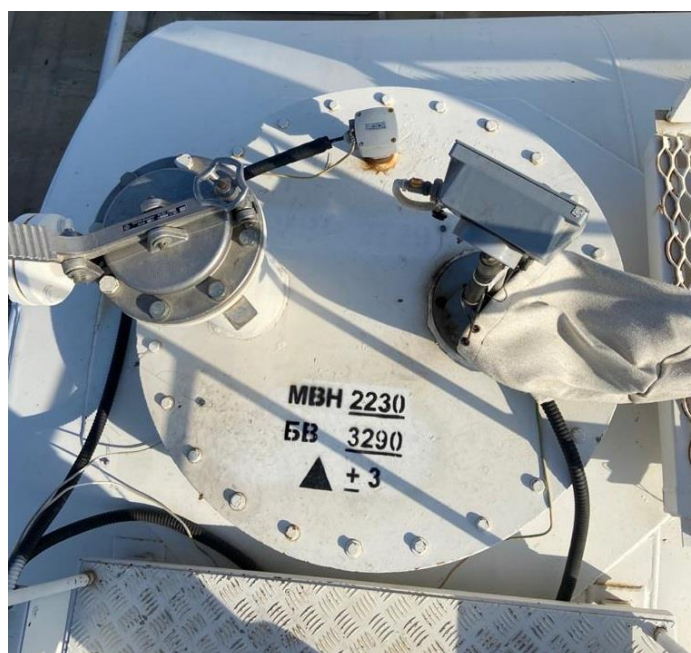
Рисунок 2 – Общий вид резервуаров РГС-50 зав.№№ 2895, 2896, 2897, 2898