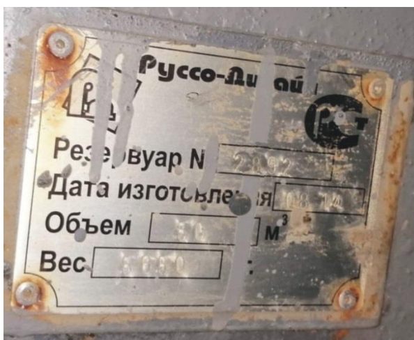
Рисунок 8 – Маркировочная табличка резервуара РГС-50 зав.№ 2892