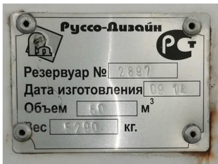
Рисунок 5 – Маркировочная табличка резервуара PTC-50 зав.№ 2897