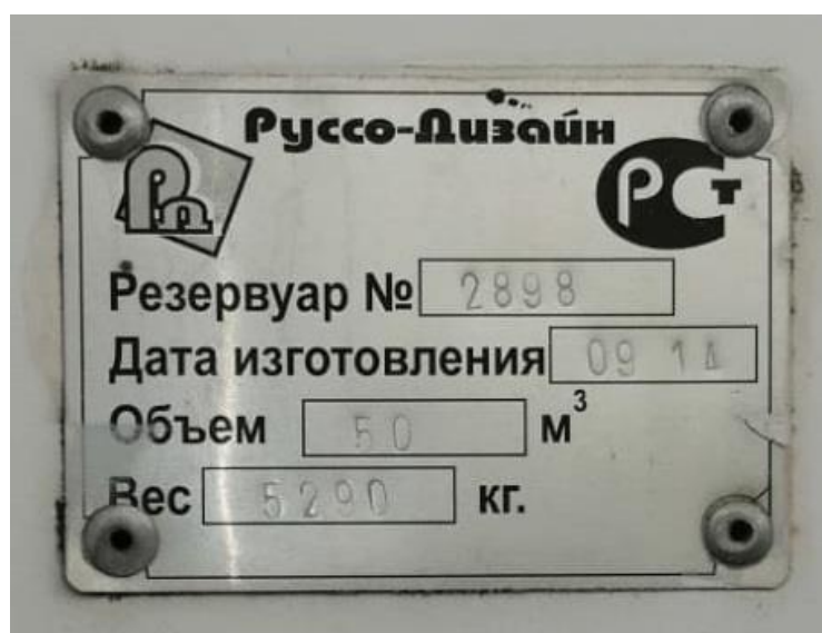
Рисунок 6 – Маркировочная табличка резервуара PTC-50 зав.№ 2898