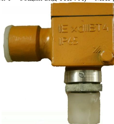
Рисунок 2 – Общий вид датчиков НОРД-И2У-02, НОРД-И2У-04