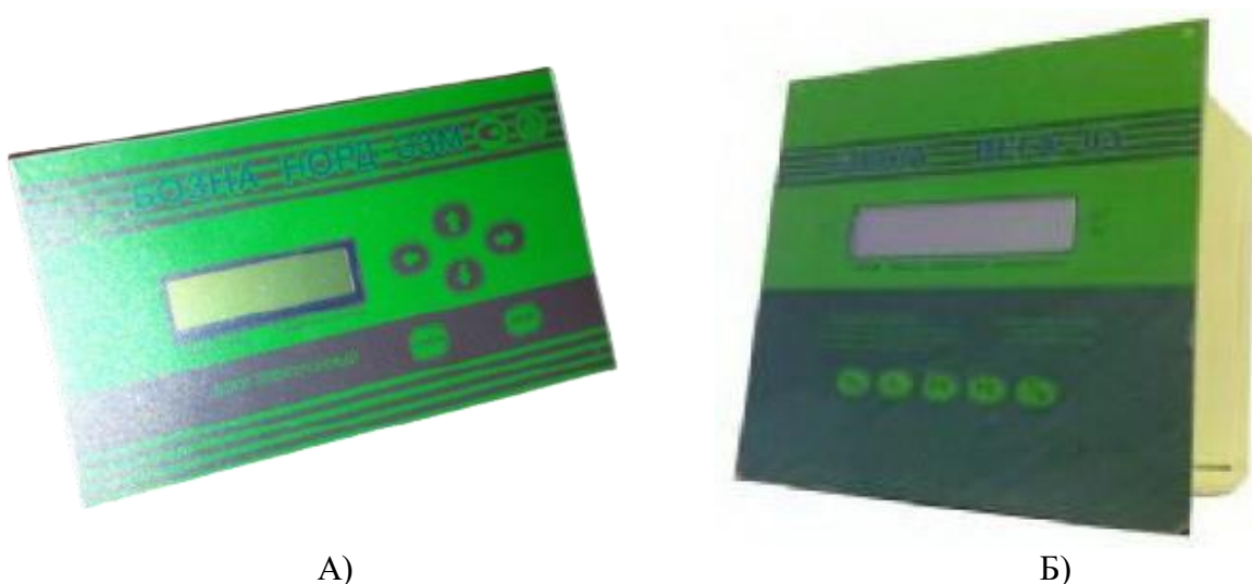
А) Б) Рисунок 3 – общий вид блока: А) – НОРД-ЭЗМ ; Б) - VEGA-03