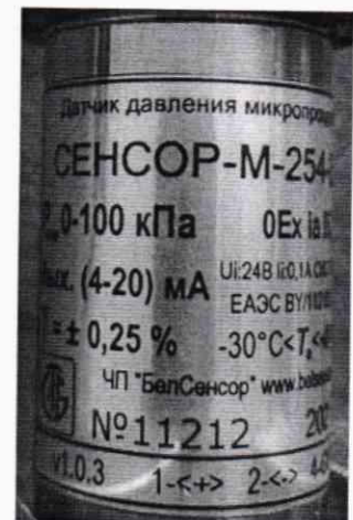
Рисунок 1.2 – Маркировка датчиков