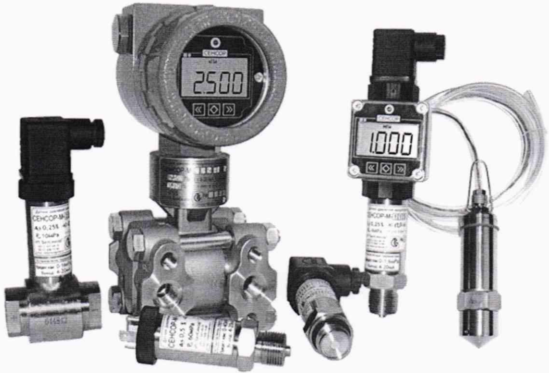
Рисунок 1.1 – Общий вид датчиков