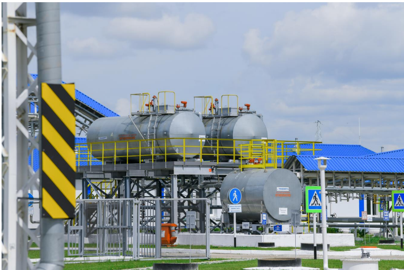
Рисунок 2 – Общий вид резервуаров РГС-20

Пломбирование резервуаров РГС-20 не предусмотрено.