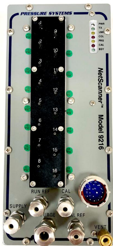
Рисунок 1 – Общий вид измерителя давления многоканального исполнения 9216-9905011300

Внешний вид измерителей представлен на рисунке 1, 2 Место нанесения знака поверки представлено на рисунке 3 Пломбирование измерителей не предусмотрено.