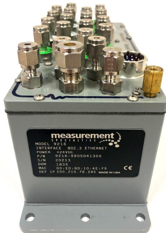
Рисунок 2 – Общий вид измерителя давления многоканального исполнения 9216-9905041300