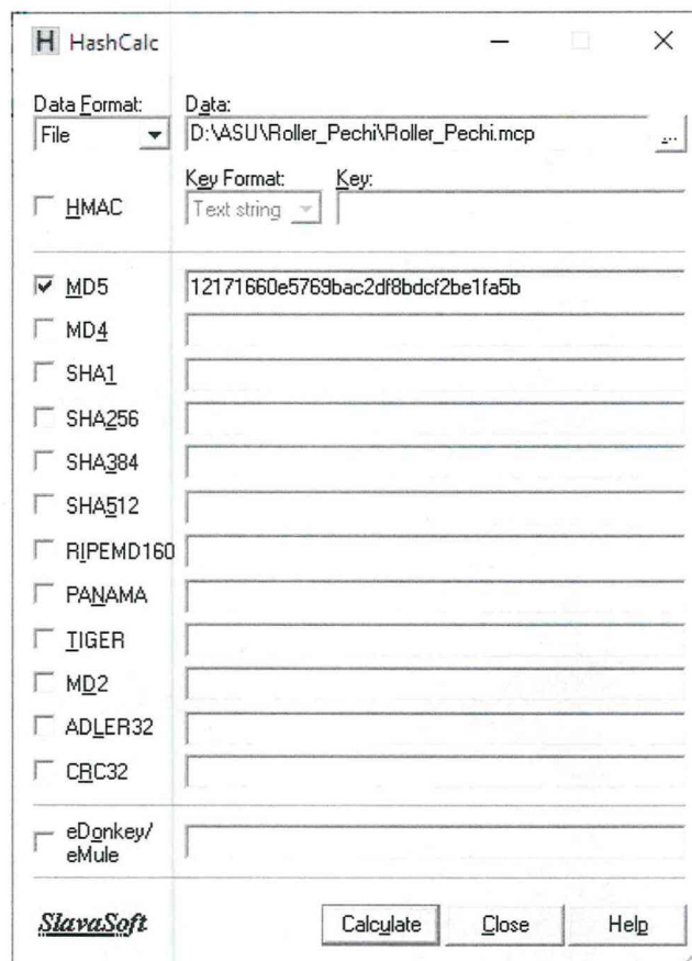
Рисунок 2 – расчет контрольной суммы MD5 файла конфигурации станции визуализации

9.4 Результат проверки положительный, если контрольные суммы файлов конфигурации проектов совпадают с приведенными в описании типа на ИС.