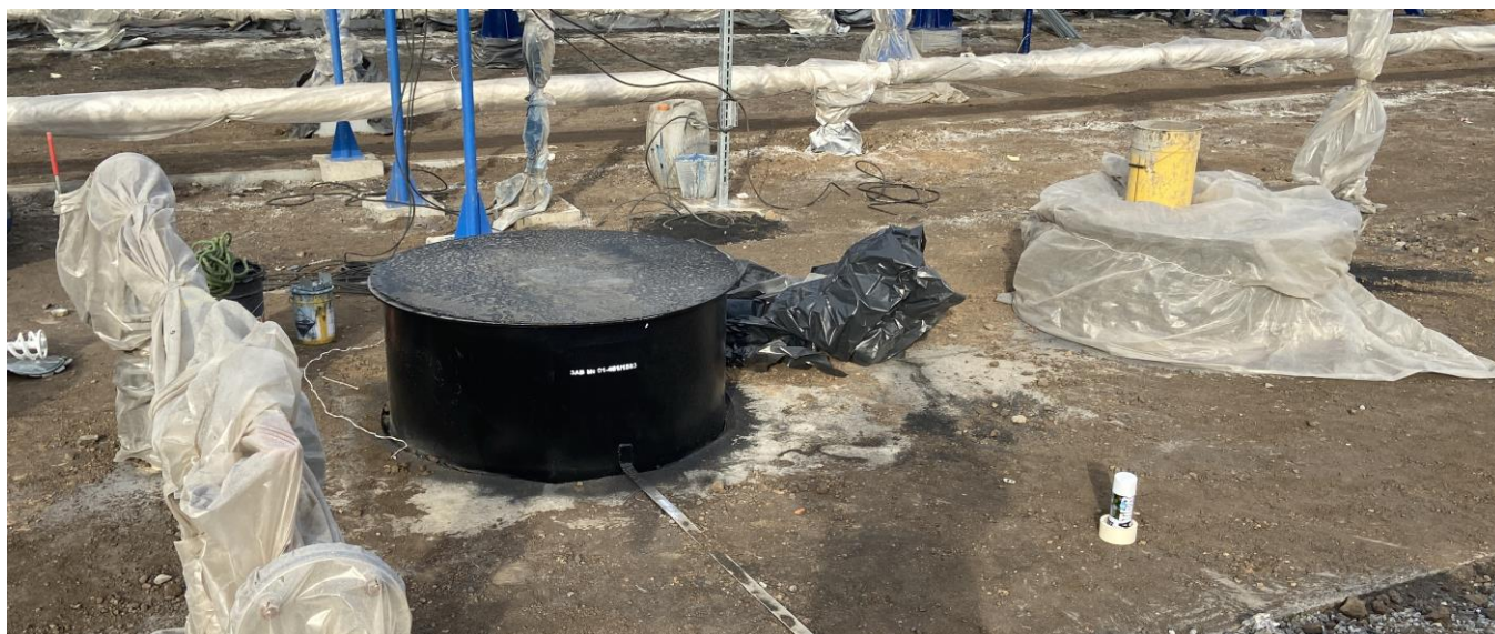
Рисунок 2 – Общий вид резервуара РГС-50