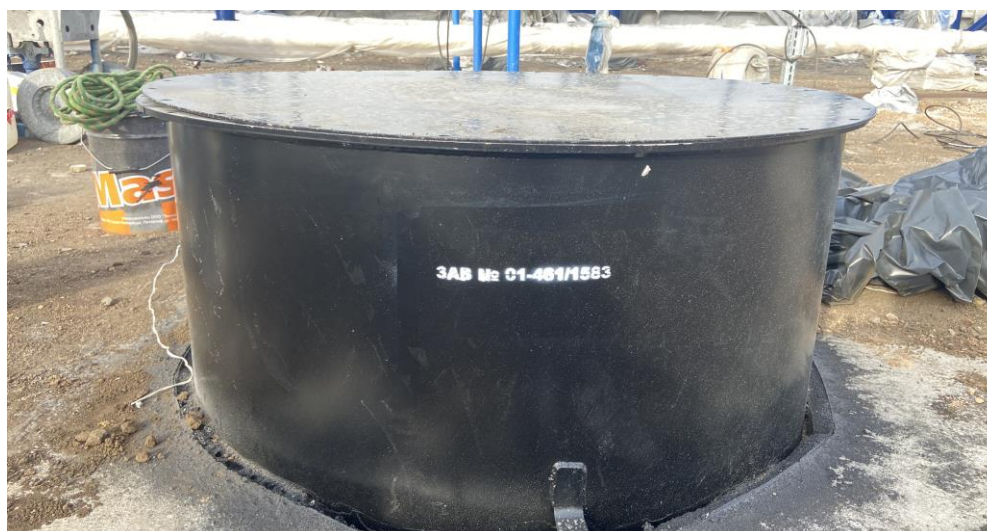
Рисунок 1 – Место нанесения заводского номера

Нанесение знака поверки на средство измерений не предусмотрено.