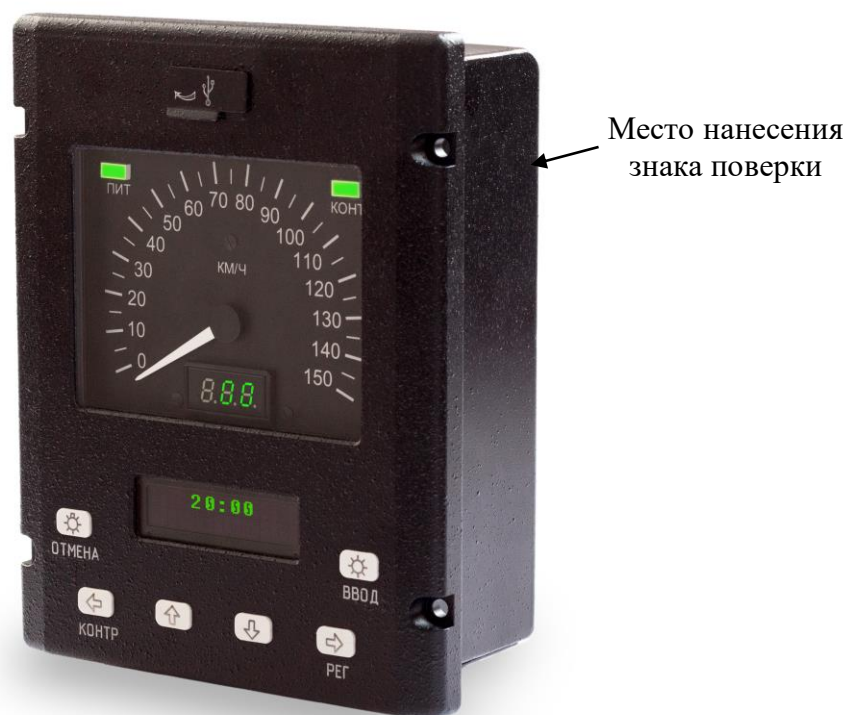
Рисунок 2 – Общий вид БУ-4